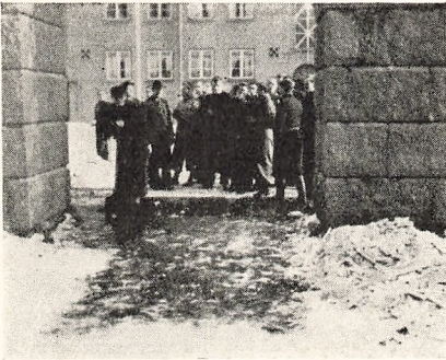
Herover: Vinterbillede. Esbjerg.