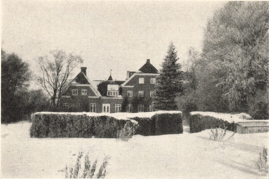
Skolen i Sne.