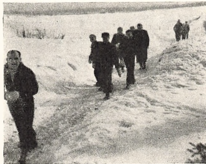
Nedenfor: Ogsaa Vinterbillede. Esbjerg.