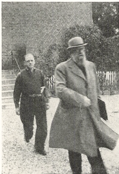
Roskilde. Stauning besøger Skolen.