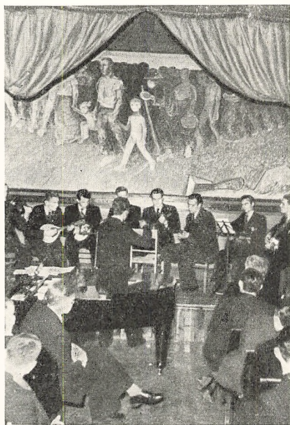
Roskilde. Skolens Orkester ved Solhvervsfesten.