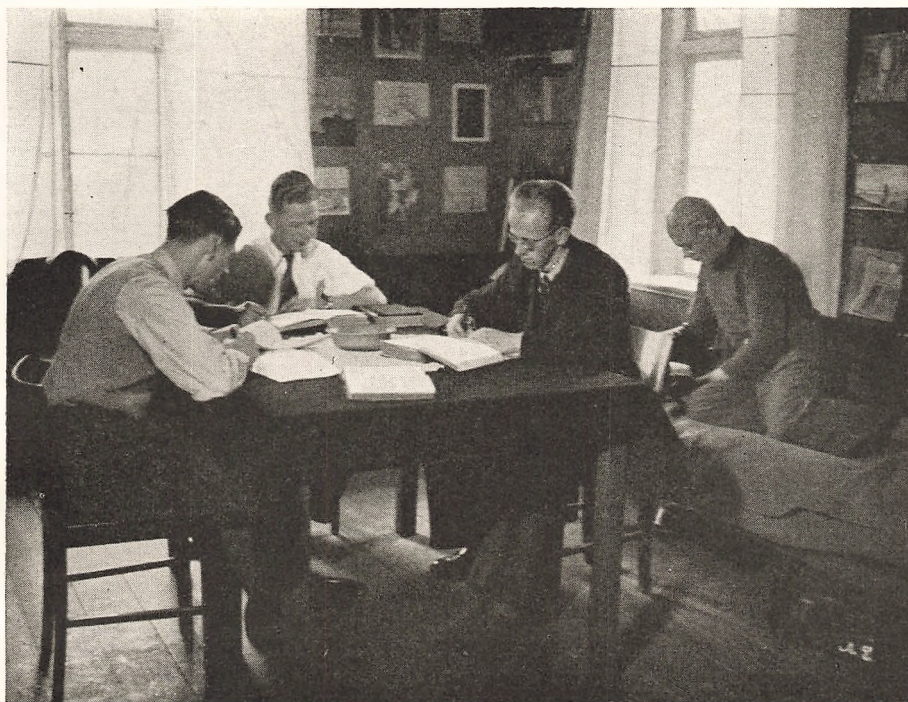
Der arbejdes paa Værelse 3.