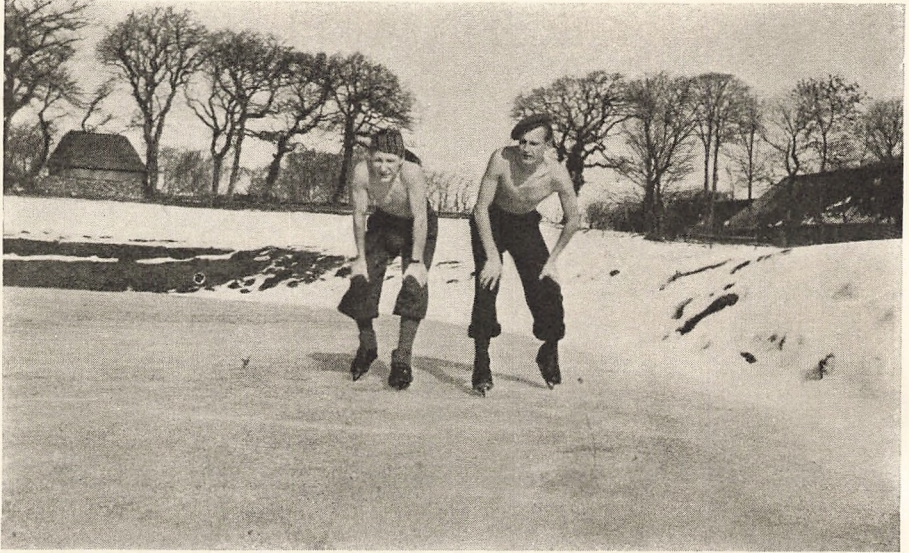
Paa Skøjter i Vintersol.