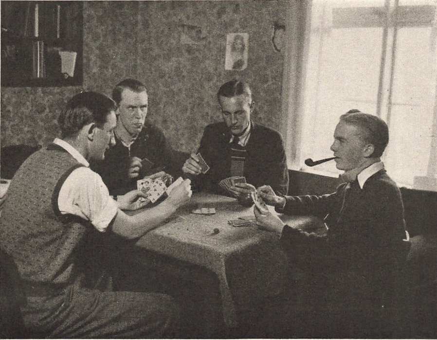
Efter vel udført Arbejde paa Værelse 7.