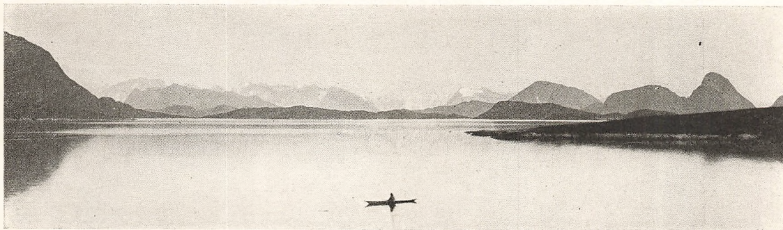
Attentred over Fjorden.