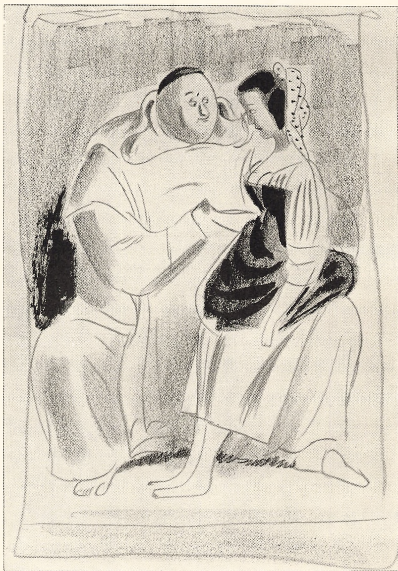
Tegning af Arne Ungermann.