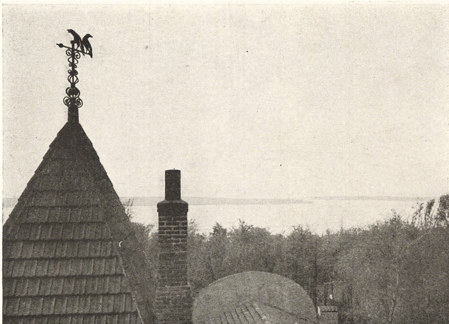
Ravnene hilser det graa Foraar.