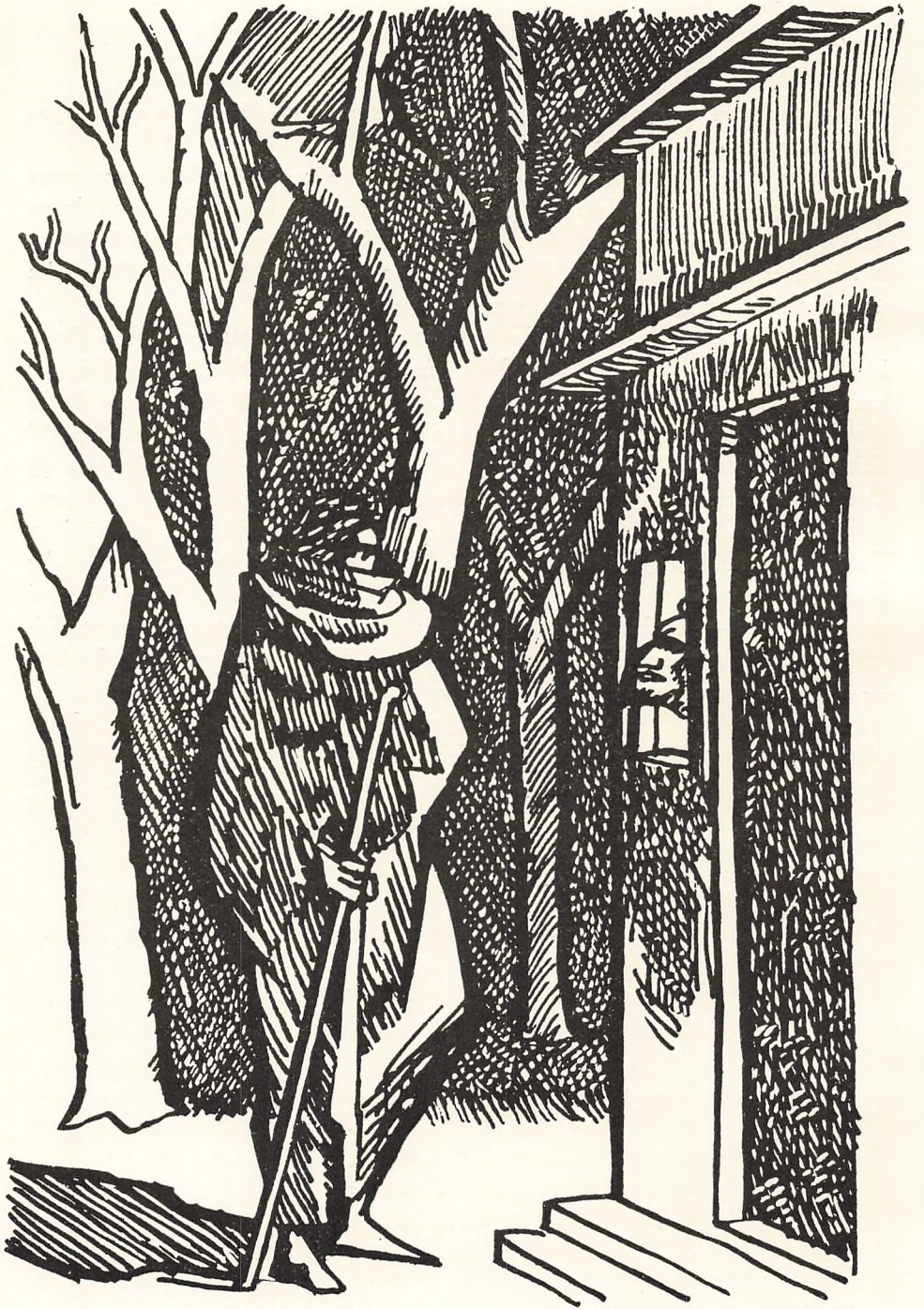
Transnit af Axel Salto.