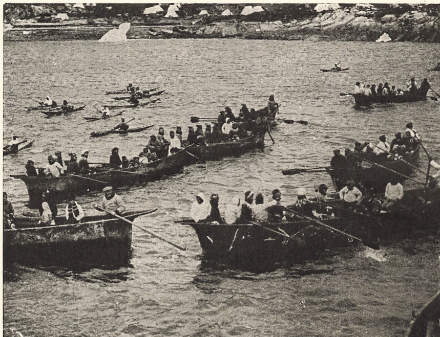
Konebaade og Kajakker samlet til Fest.