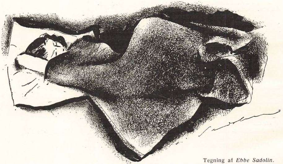
Tegning af Ebbe Sadolin.