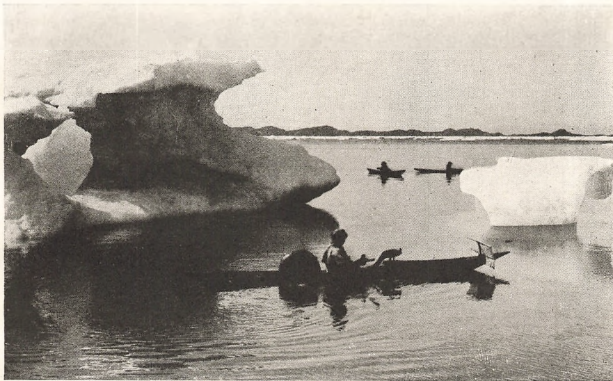
Kajakker i Storis.