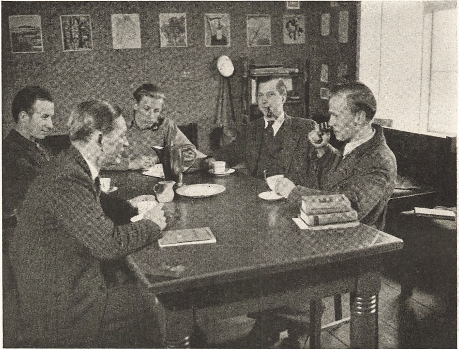
Kaffeklubben er samlet paa Værelse 8.