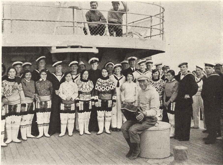
»Dansemik« paa Ingolfs Agterdæk.