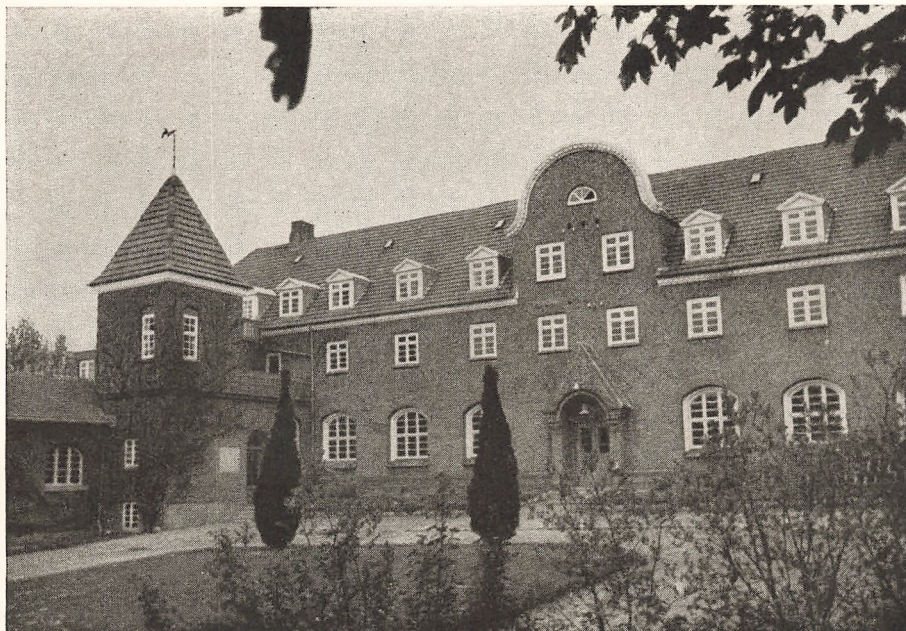
Skolen hviler tom efter Vinteren.