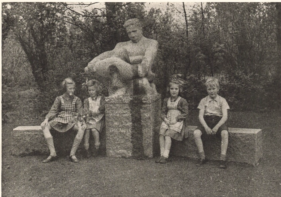
Aaget og Vinteren er brudt.