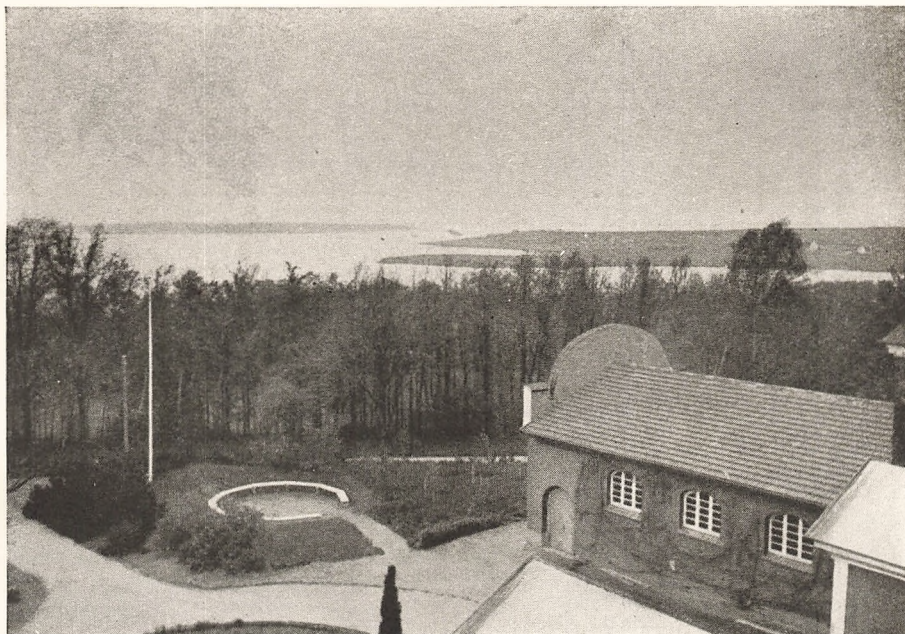
»Her mødes Muld og Hav i kærlig Favnen.«