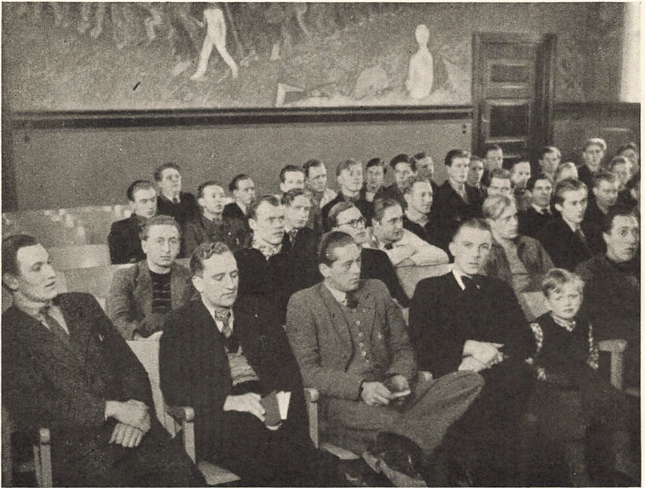
Salen var ikke fuld i Aar.