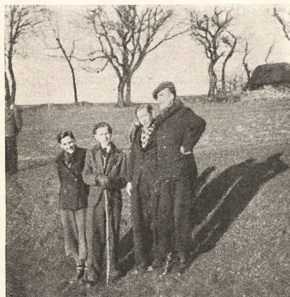
Hjem fra en længere Skovvandring.