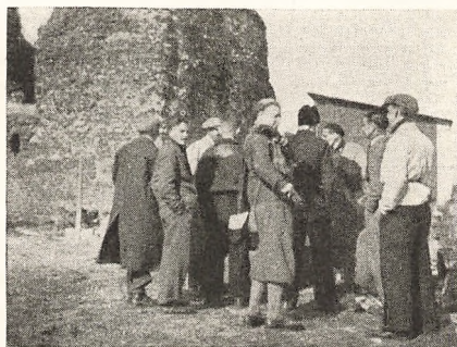
Ved Kalø Ruin.