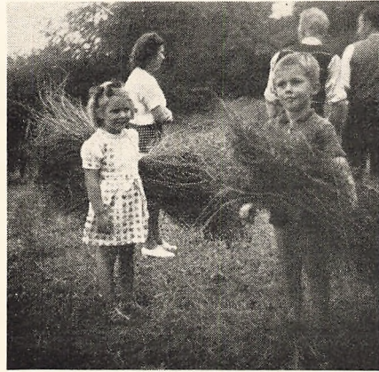
To smaa Ruskere.