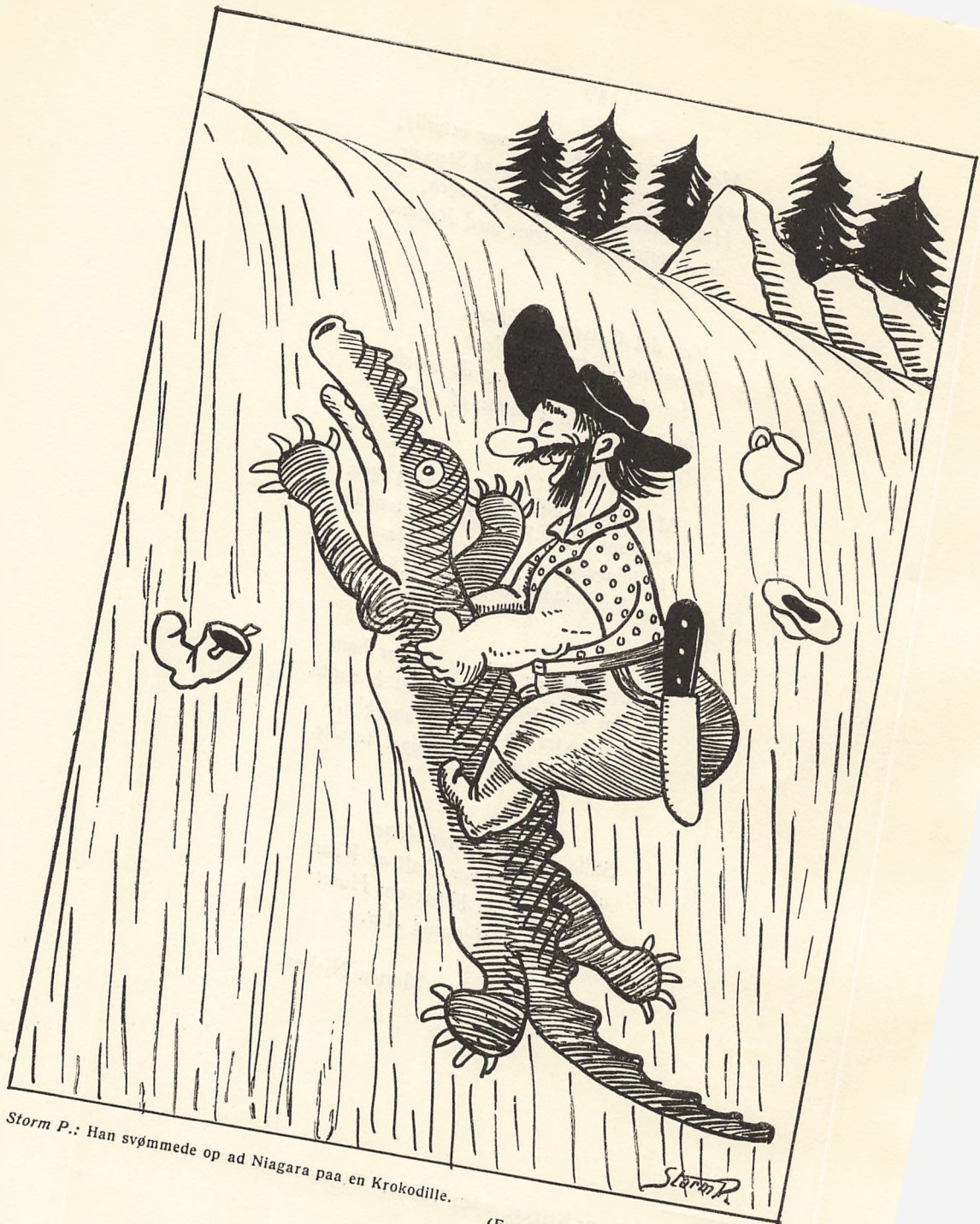
Storm P.: Han svømmede op ad Niagara paa en Krokodille.