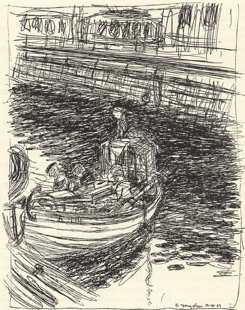
Ib Spang Olsen: Tegning. (Fra »Vild Hvede«. 1944.)