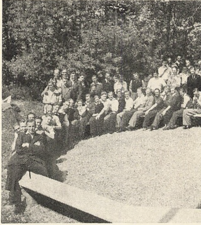
Gryden i Kogt