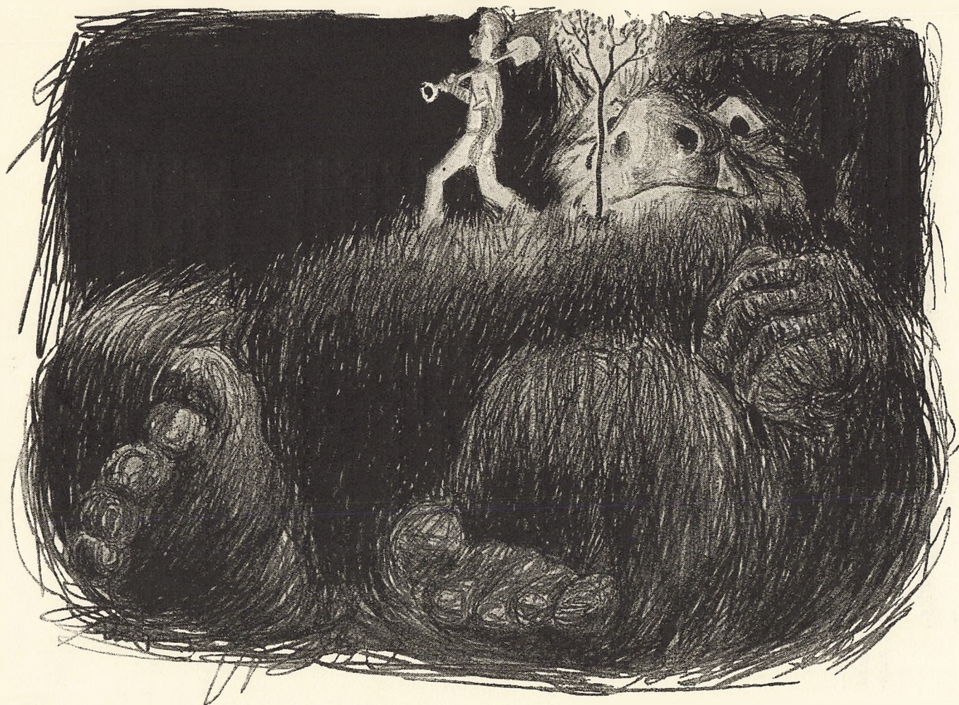
Ib Spang Olsen: Ungdom. (Fra »Notabene«, 1944.)