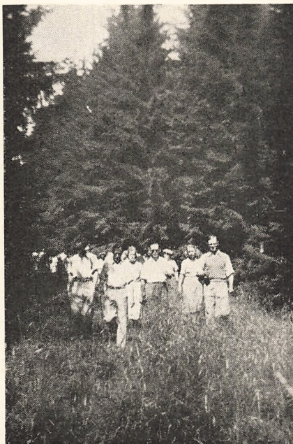
Blandt Frijsenborgs Graner.