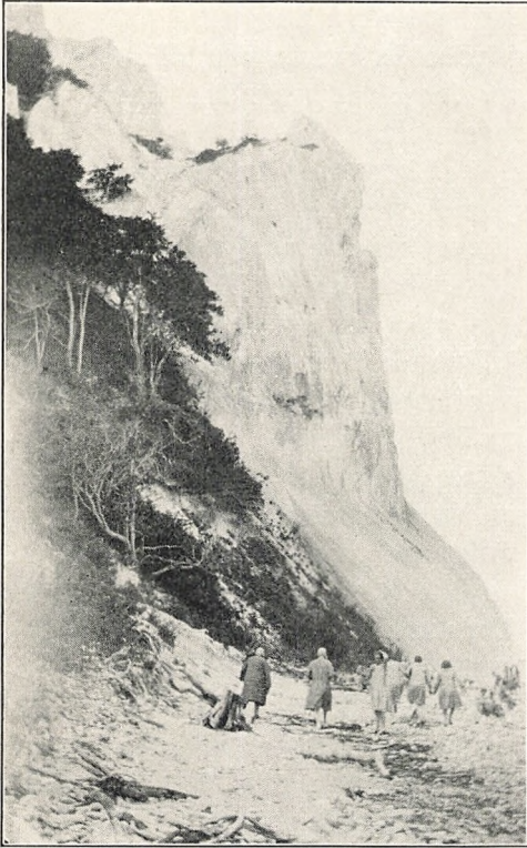
Fra Møens Klint.

Vor Stortur gik i Aar til Møens Klint. De allerfleste af vore Elever havde aldrig været der, og vi vidste, at det vilde