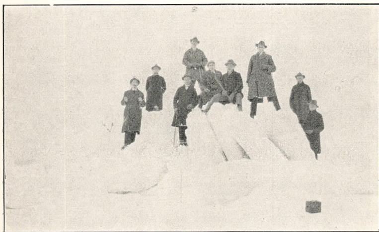
Isskruninger ved Korsør.

Ja, det havde vi haft. Men jeg kan ikke slutte denne Beretning om Vinterskolen uden at nævne, at en stor Sorg ramte et af vore Lærerhjem, en Sorg; som vi andre inderligt