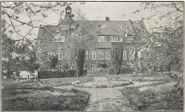
Da Foraaret kom.