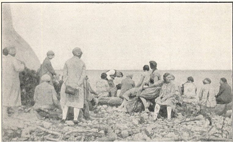
Ved Klintens Fod.