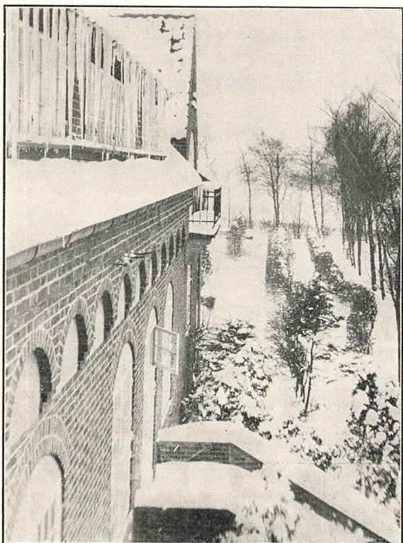
Den haarde Vinter 1928—29.

Jeg giver dernæst kun en ganske kort Omtale af andre Møder: Ved vort stærkt besøgte Julemøde talte Provst Thom-