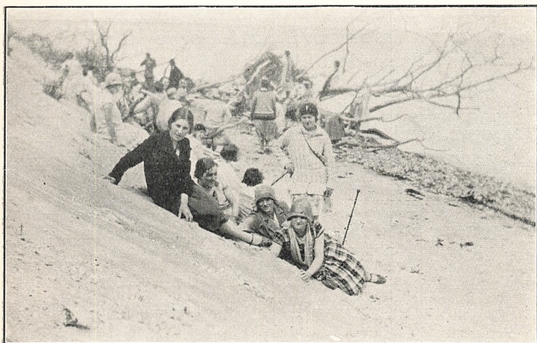
Hvile under Vandringen ved Klinten.

Derimod havde Præsten ikke noget imod, at vi samledes paa Kirkegaarden. Staaende omkring den Mindesten, som rejstes her for Grundtvig i Hundredeaaret for hans Fødsel, sang vi saa et Par af Grundtvigs Salmer, og jeg sagde et Par Ord om Stedets Minder. Og da Udby Kirkeklokke havde ringet Solen ned, sang vi „Kirkeklokke, mellem ædle Malme, mage-løs er for mit Hjerte du”. Og vi fik alligevel en god Stund i Udby. Kl. 11 var vi atter hjemme i god Behold, glade ved Dagen, og uden at der var sket noget Uheld under Turen.