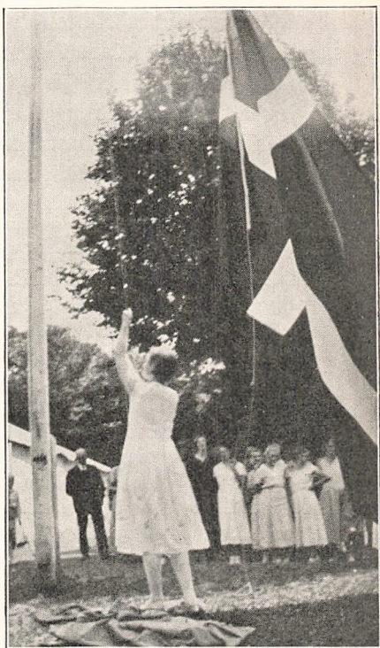
Flaget hejses den 16. Juli.