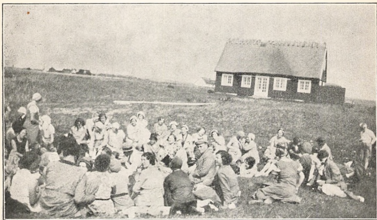
Hvil ved Stillinge Strand.

Sang og Tale vekslede, mange gode Ønsker blev udtalt for Sko-len, og Tiden gik saa godt, at det ikke mærkedes, at man, inden den sidste Tale var holdt, og mange Hilsener fra fraværende Elever var bleven oplæst, havde siddet til Bords i henved tre Timer.