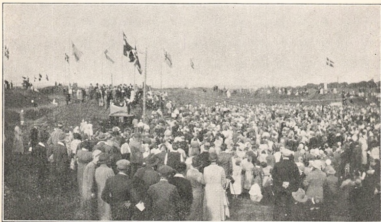
Ungdomsstævnet paa Dybbøl (et Udsnit).

smuk Sejltur til Faaborg, og saa megen Livskraft var der endnu tilbage, at Sange lød, og Legen gik lystigt paa Store Bæltsfærgen under Nissens Førerskab. Vi kom hjem Kl. 11½ om Natten, spiste Stikkelsbægrød paa dette usædvanlige Tidspunkt paa Døgnet. Og vi var en uforglemmelig Dag rigere.