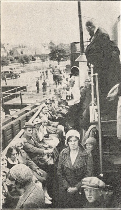
Klar til Afrejse fra Faaborg.

var vi oppe, men det var til visse ikke noget kedeligt eller morgengnavent Selskab, der gik om Bord paa Færgen. Sang lød efter Sang paa Sejladsen over Store Bælt, ogsaa i Toget over Fyn til Faaborg, ja hele Dagen var fuld af Sang. Turen gik over Faaborg—Mommarmark, med Tog over Als til Sønder-