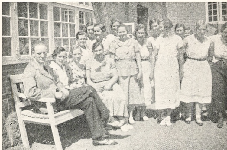
Finnen i Forgrunden.