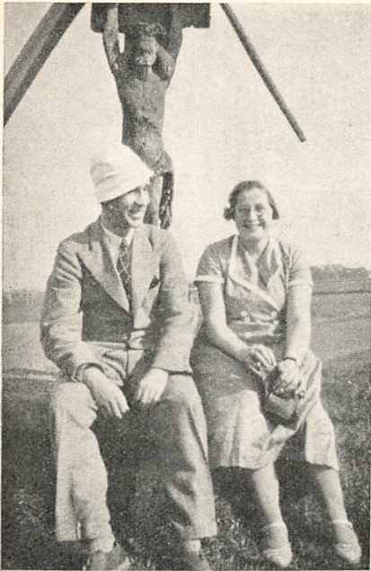
Hellig Anders som Baggrund.

sang. Inden vi tog Afsked med vore Gæster, samledes vi igen i Gymnastiksalen. Og den gode Dag sluttede med en Aftensang.