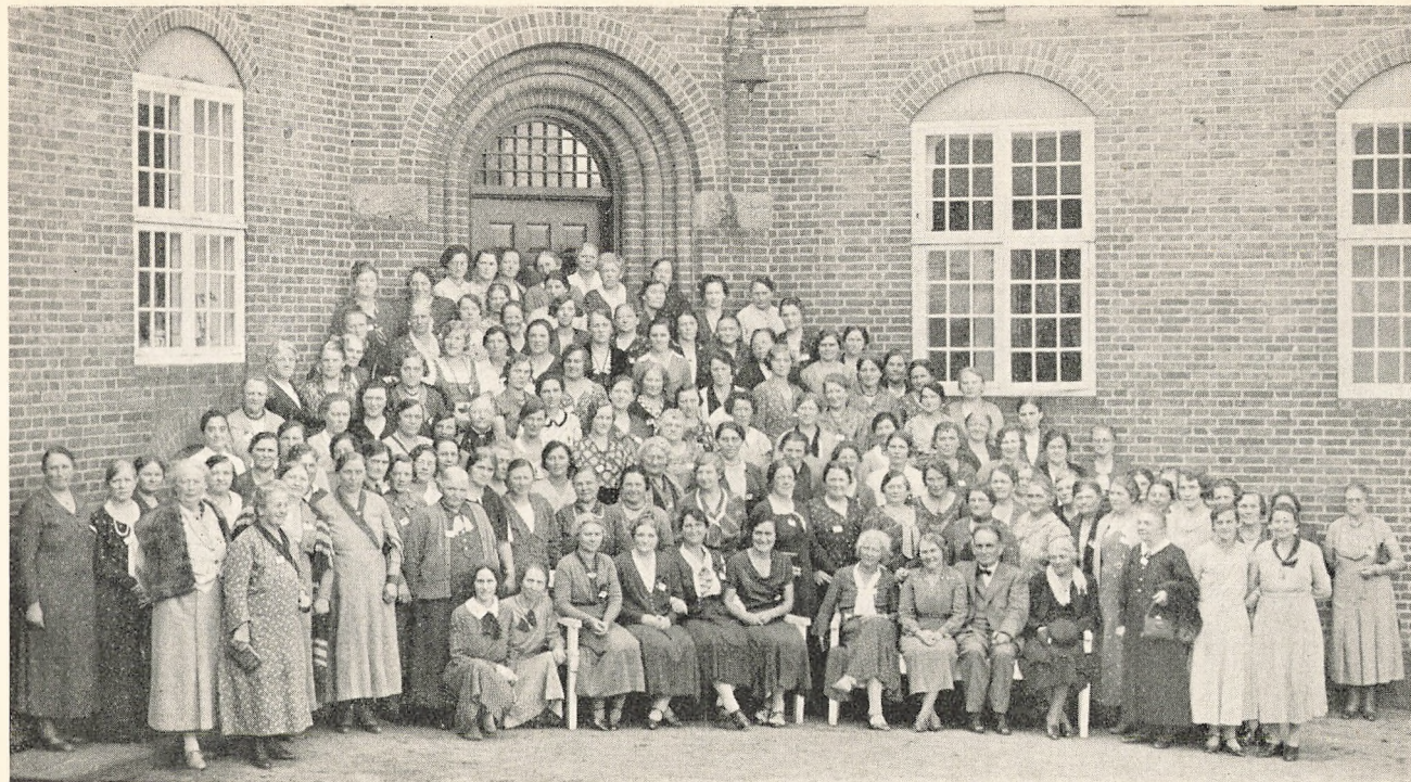
Deltagerne i Oplysningsugen.