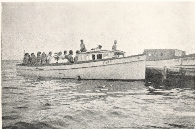
Sejltur paa Sorø Sø.

I NDEN jeg skriver mere om vore udendørs Ting, maa jeg vist helst, om denne Beretning skulde blive læst af Folk,