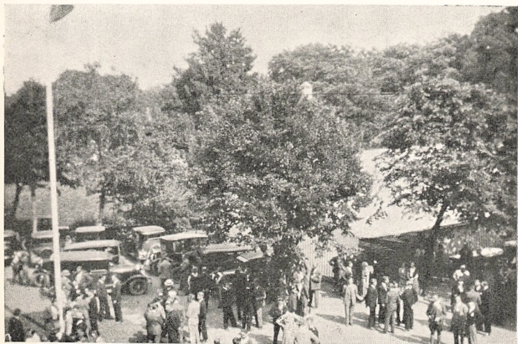
Saadan ser Skolepladsen ud paa Elevmødedagen.

hvad en Højskole er. Jeg tror, at de Folk den Dag fik mere Kendskab til Højskolen, end 14 Hverdage kan give. De for-