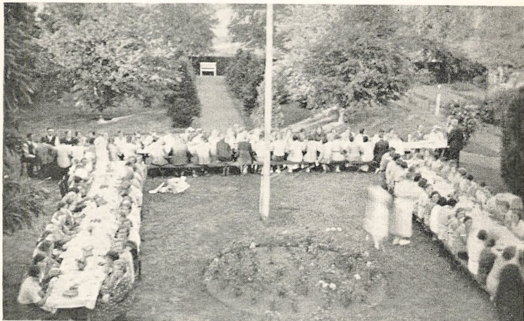
Ved Kaffebordene i Sædder.