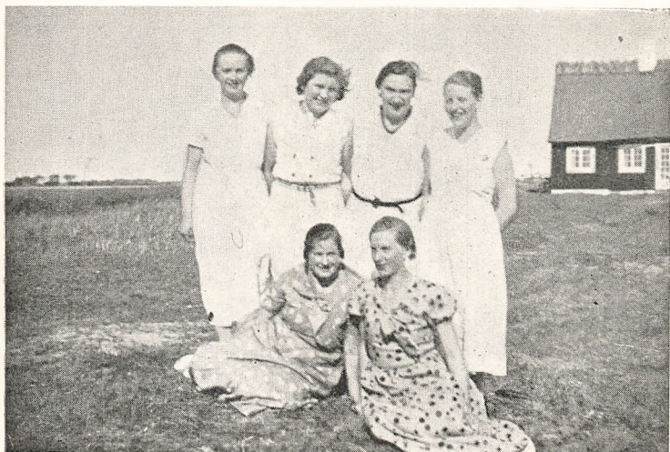
Ved Stillinge Strand.