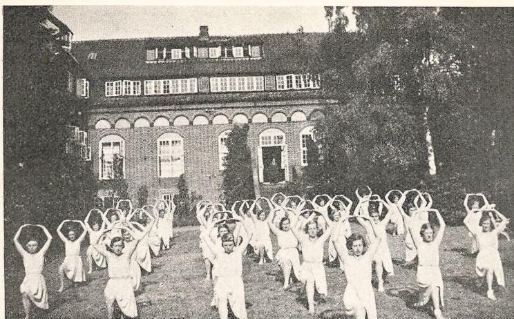
Gymnastik paa Græsplænen.

ogsaa økonomisk, var stærkt præget af Jubilæet, bl. a. Udgivelsen af Jubilæumsskriftet. Foreningens Medlemstal er ca. 1900.