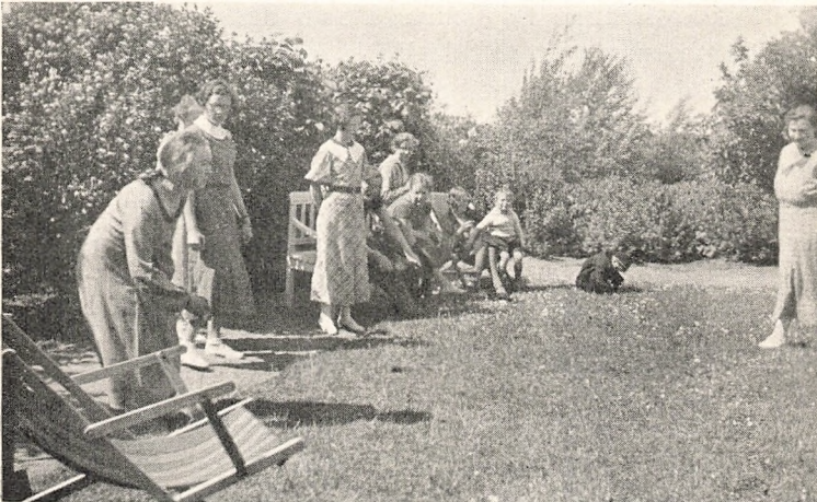
Fra Nissens Have.

Der kan over en Højskoles Sommerkursus være en Glæde,