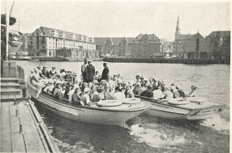
Sejltur i Københavns Havn.

Turen til København havde vi lagt tidlig paa Sommeren,