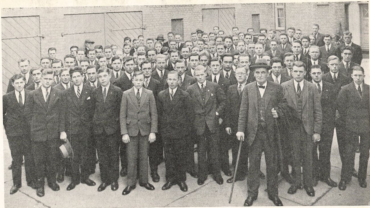
Paa Besøg i „Sorø Amtstidende“s Trykkeri.