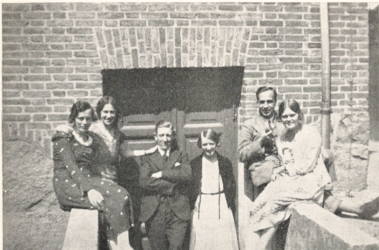
Det unge Mandskab i Solskin.

N U ER JEG naet frem til Elevmødet, Sommerens største og festligste Sammenkomst. Vi havde engang en Elevmødedag Besøg af nogle Folk, der ikke kendte ret meget til,