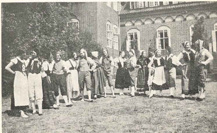
Opstilling til Folkedans.

Elevmødet i Aar havde samlet omtr. 700 Elever fra alle Egne af Landet, selvfølgelig var de sidste Hold stærkest repræsenterede, saaledes mødte ikke mindre end 80 af Vinterholdet 1933—34. Men her kan jeg benytte „Sorø Amtsti-