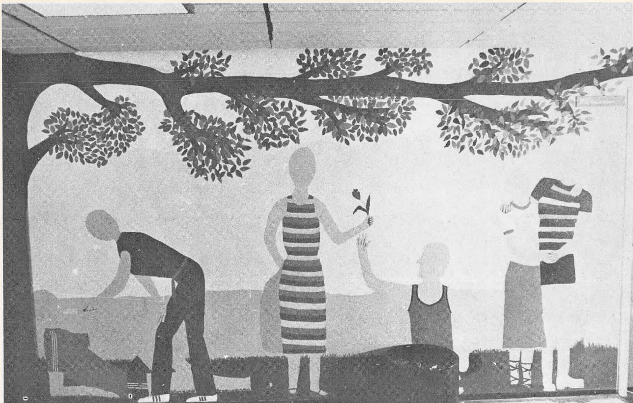
Udsmykning i kantine 2 ved elever i skoleåret 1980/81.