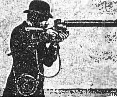
Marey's foto-kanon i brug, sandsynligvis med Marey selv som fotografen.

Undervisningen i filmkundskab - faget burde i virkeligheden hedde mediekundskab - omfatter 3 hoveddiscipliner: filmanalyse, praktisk filmarbejde med super 8-optagelser, video samt tv-analyse. I første og andet semester prioriteres alle fagområder lige højt.