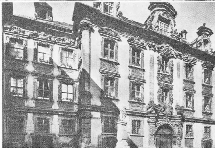
Fra IVA's Tysklandstur juli 1961.