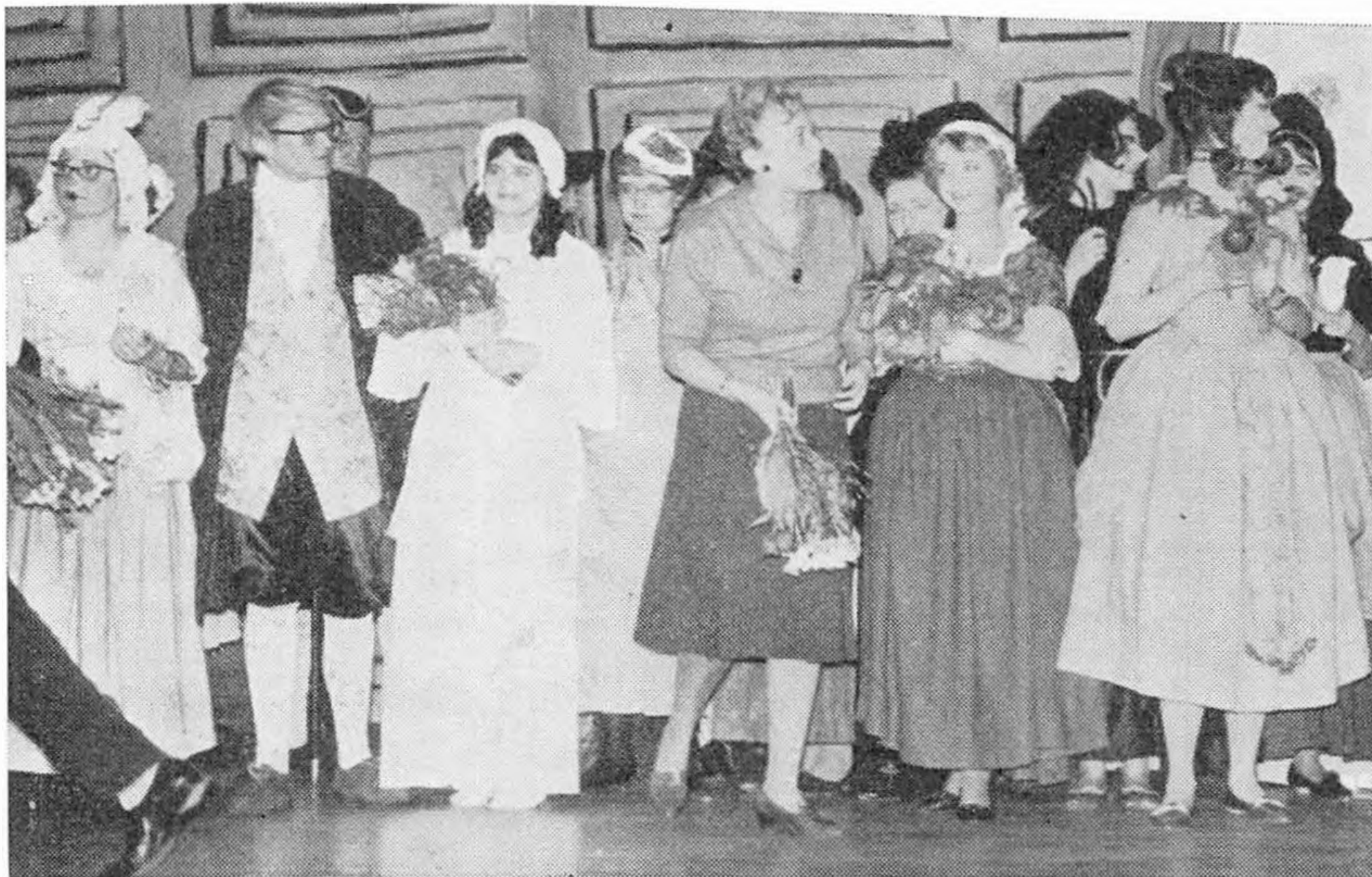
Fra Iig's skolekomedie marts 1962.