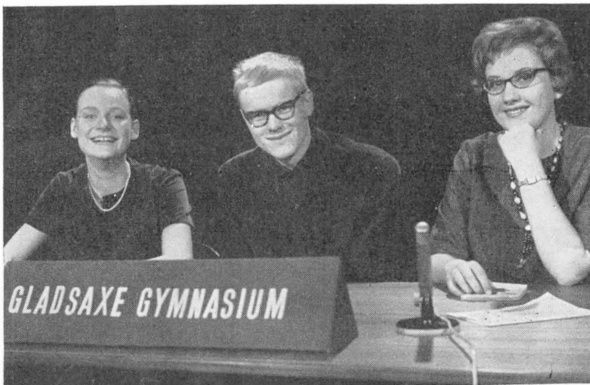
Finaleholdet i »Kvikke hoveder« 1962,