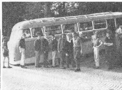
Fra IVa's Tysklandstur juli 1961.