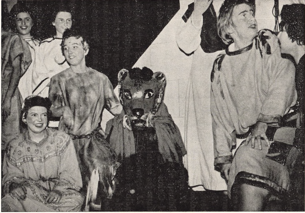
Androkles og løven 1959