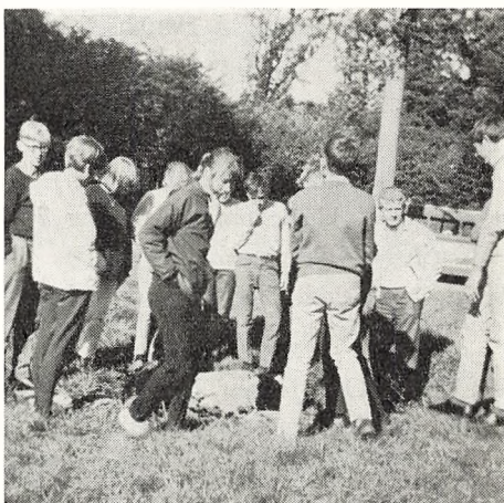
I real ved bronzealdergravene i Als Nørreskov