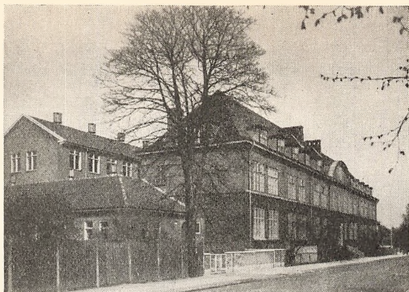
Skolen set fra Skolevej