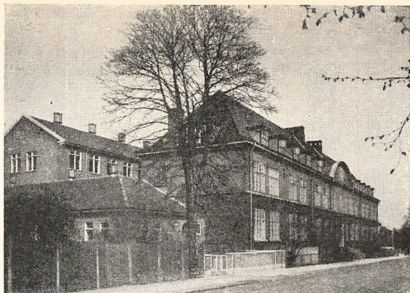
Skolen set fra Skolevej