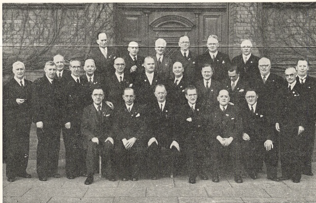
50 Aars Jubilæerne.

meratskabet og Aanden i Skolen i Ny Munkegade, den som vi aldrig glemmer.