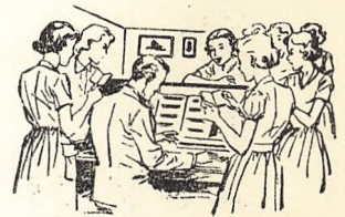
Der synges på alle sprog