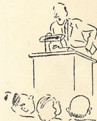
Man indfanges af emnet