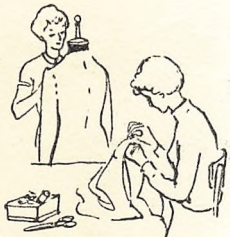
Kjolesyning — det næststørste fag