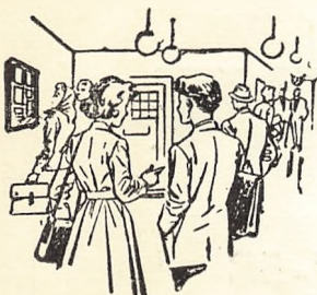
Man træffer nye kammerater

for elever mellem 14 og 18 år. Ingen indskrivningspenge — gratis materialer.