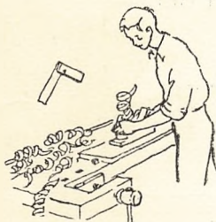
Selvgjort er velgjort