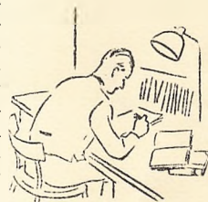
Interessen er vakt