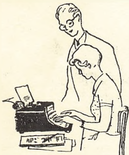
Maskinskrivning — tidens løsen