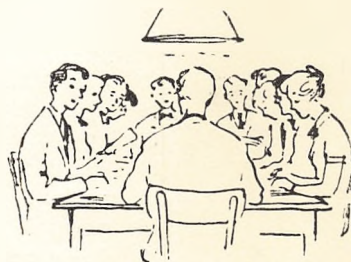
Problemer under debat