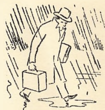
Det kan være surt —

TORS DAG Personerne i Holbergs komedier — deres rod i fortiden — deres betydning for moderne nordisk dramatik, illustreret ved foredrag, oplæsning og instruktion. På Aftenskolen kl. 19.