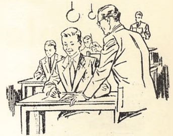
Man lærer at udtrykke sig skriftligt

I indskrivningspenge betales 5 kr. pr. fag, hvoraf 2 kr. tilbagebetales elever, der ikke forsømmer. Materialer betales efter forbrug (alm. madlavning 25 kr., finere madlavning 35 kr.) Begyndere kan i begrænset omfang leje væve, som betales med 5 kr. ved indmeldelsen.