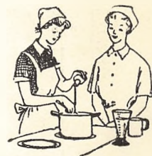
Man tager . . .