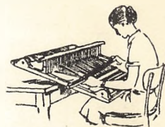
I vævning laves skønne ting