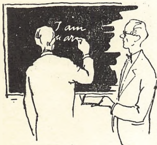
Fremmedsprog — Aftenskolens største fag

Den omfatter historisk orientering, udarbejdelse af arbejdstegninger samt indøvelse af teknikken i hulsøm, sammentrækssyning, dragværk, hvidsøm, almuesyning m. m.