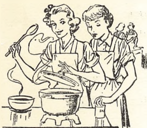
Vejen til mandens hjerte —