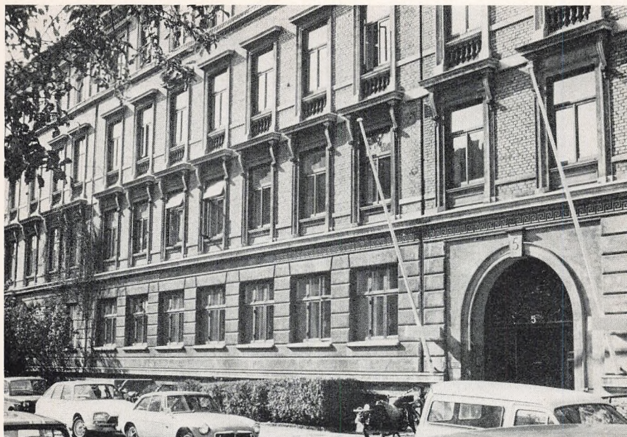
Kursus' bygning på Mynstersvej 5.