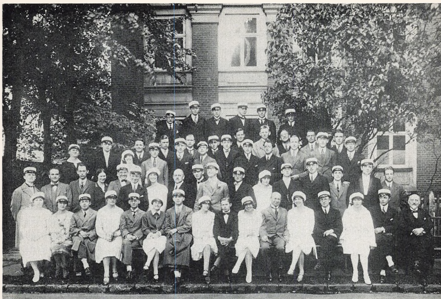
Studenteholdet 1927 – altså 50-års jubilarene i juni 1977.