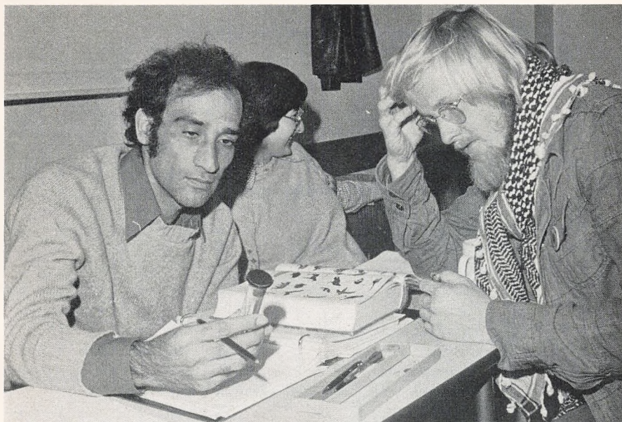
Der læses biologi.

Ved indmeldelsen skal man meddele, om man vil læse fransk eller russisk og engelsk eller tysk. Det skal dog bemærkes, at der normalt ikke er ansøgere nok om aftenen til tysk, og at russisk kun kan vælges om dagen.