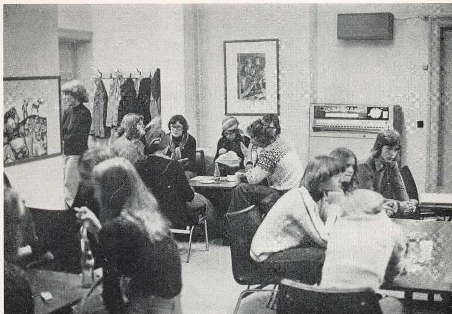
Et af elevernes opholdsrum.

kursusårets slutning års- og eksamenskarakterer til studentereksamen.