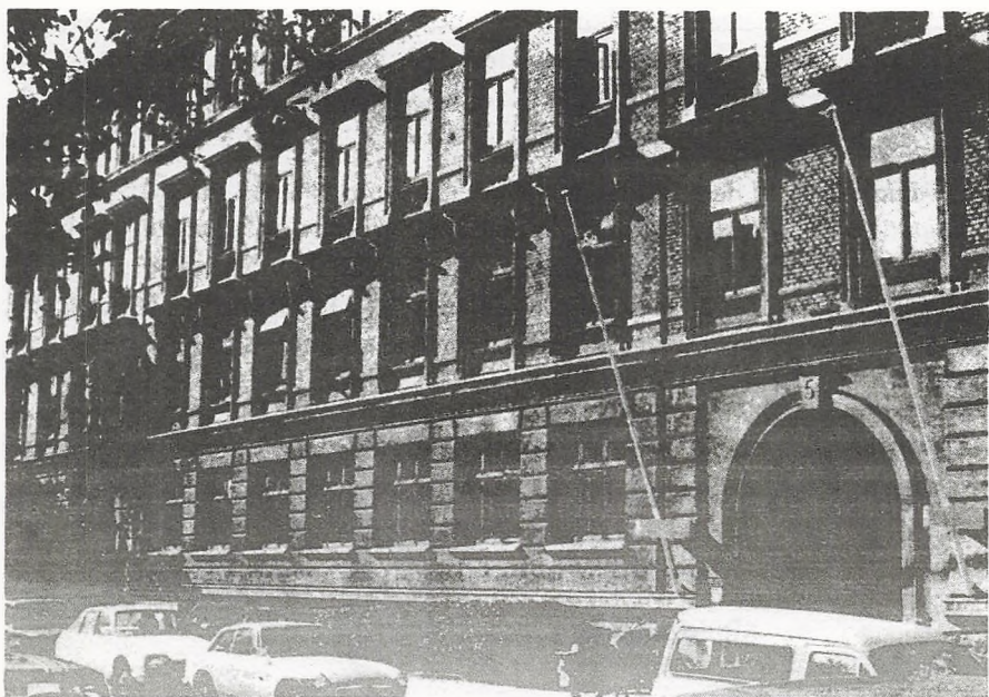
Kursus' bygning på Mynstersvej 5.