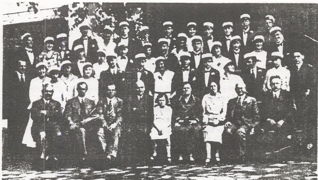
Studenterholdet 1931 – altså 50-års jubilarene i juni 1981