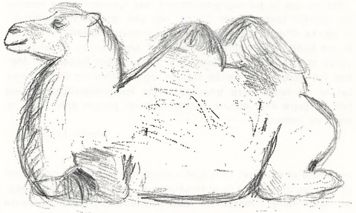
Mette Riis, 6. x.