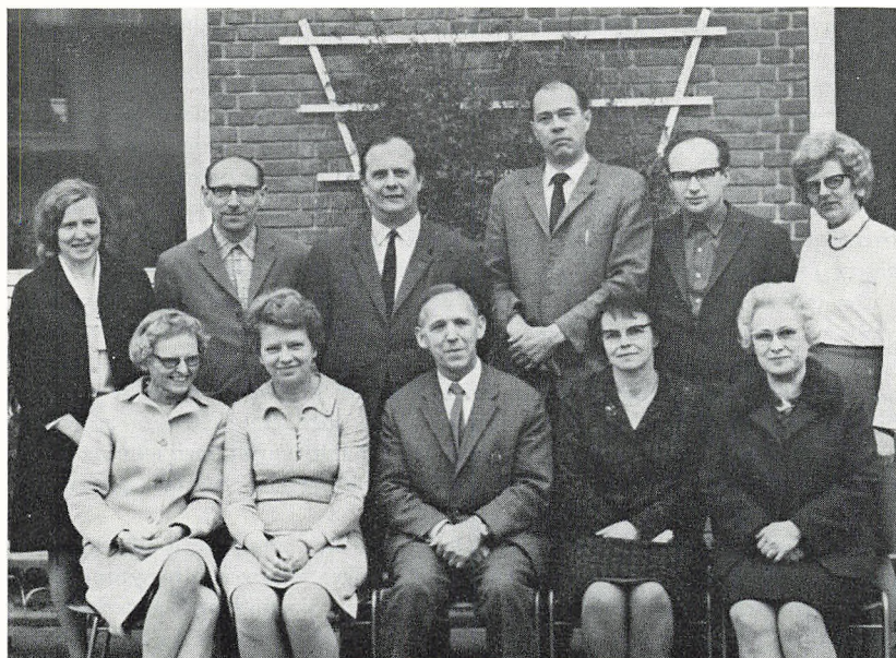
Skolens lærere maj 1969