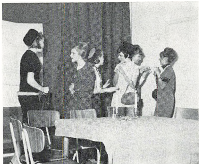
Møde i dameklubben