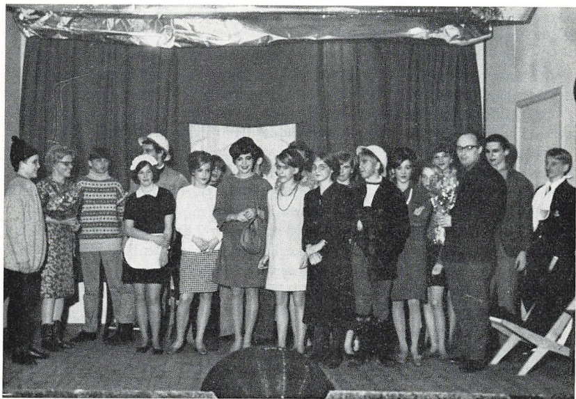
»Alle blev reddede«

Der har i årets løb været afholdt flere bestyrelsesmøder, hvor man foruden, hvad der allerede er nævnt, har behandlet spørgsmål som: udstedelse af gældsbreve i forbindelse med optagelse af lån hos gamle elever, godkendelse af skolens regnskab, fastsættelse af skolepengenes størrelse, skolepengenes sættelse, oprettelse af nye klas-