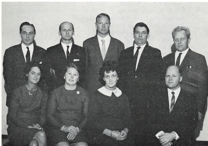
Skolens bestyrelse 1969