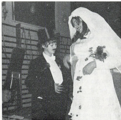
Brudeparret ved elevernes egen fest