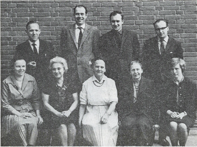
Lærerinder og lærere — maj 1963