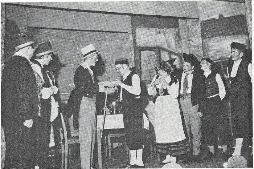
»En søndag på Amager«

friskt og fornøjeligt og sang af hjertens lyst, så stykket blev det, det skulle være, et lystspil.