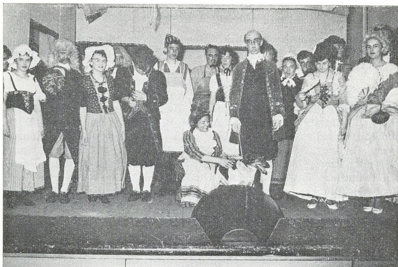
»Den politiske kandestøber«

skulle altså frit kunne vælge deres barns skole, men er denne frihed ikke temmelig illusorisk, hvis de gennem skolepenge — som en slags bøde for en tiltaget rettighed — skal betale for friheden? Børn må ifølge den nye skolelov ikke tvangsindlægges i en privat skole. Foreløbigt må de dog nok tvangsindlægges i offentlige skoler, når forældrene ikke kan betale på en privat skole — måske bl. a. fordi de gennem skatter skal være med til at betale udgifterne til det offentlige skolevæsen. Var det mon ikke rimeligt, at man gav forældrene så megen frihed, i tillid til deres egen dømmekraft, respekterede deres egen dog umiddelbare interesse i sagen, at man i givet fald betalte skolepengene for de tre år i realafdelingen, mens forældre så til gengæld for »livstid« fortsatte med at betale skolepenge som skatteydere? Skulle dette være en urimelig tanke i en tid, hvor millionærer kan få folkepension? — Jeg vil her udtrykke ønsket om, at dette synspunkt, der utvivlsomt deles af mange, som finder det naturligt, at private skoler trives side om side med offentlige, gennem lovgivningsmagten må blive ført ud i livet, i erkendelse af, at forældre har ret til selv at bestemme over deres børns skolegang, uanset tykkelsen af deres tegnebog og uafhængigt af lokal skolepolitik.