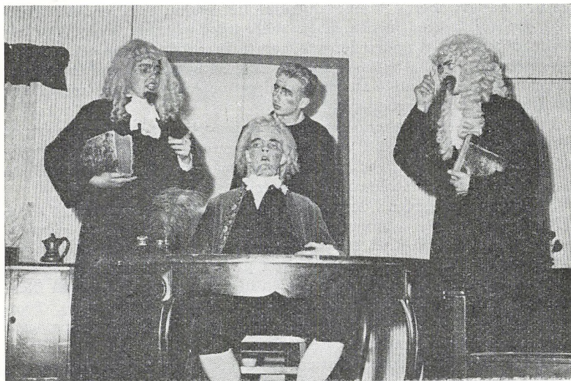
»Den politiske kandestøber«