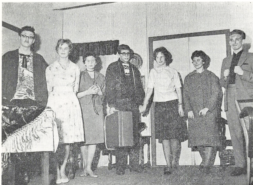
»Pas på malingen«

bekæmpelse af spedalskheden. Takket være elever og læreres energiske indsats kom vi op på det smukke resultat af kr. 613.