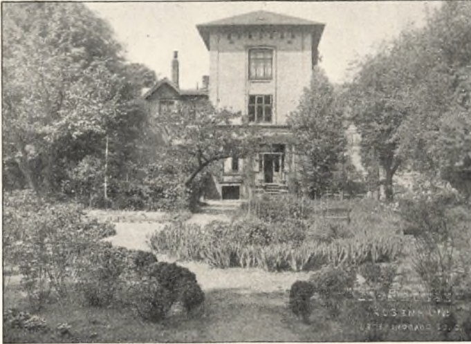
H. F. FEILBERGS FORBEREDELSESSKOLE ROSENVÆNGETS HOVEDVEJ 16.