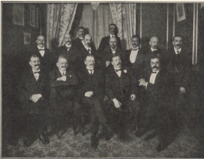
Navnene læste fra venstre til højre.