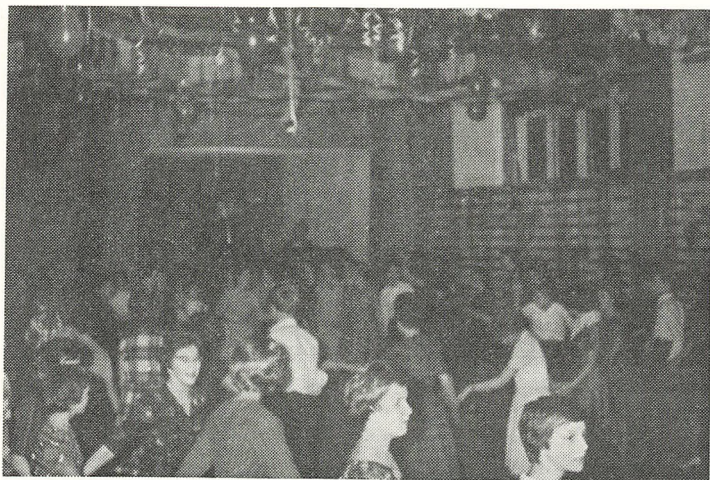
Man morer sig

5. og 6. oktober: Forældreaftener i 5. klasserne. Redegørelse for den ny skolelovs bestemmelser — kaffebord — frit ordskifte — forældrenes drøf- telser med lærerne.