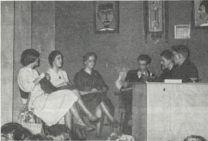
De stjalne opgaver