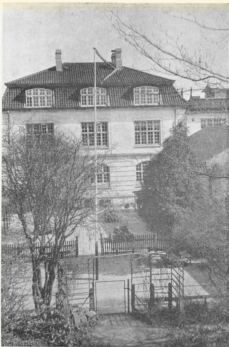
Skolebygningen og de to Legepladser — Underklassernes Legeplads i Forgrunden.