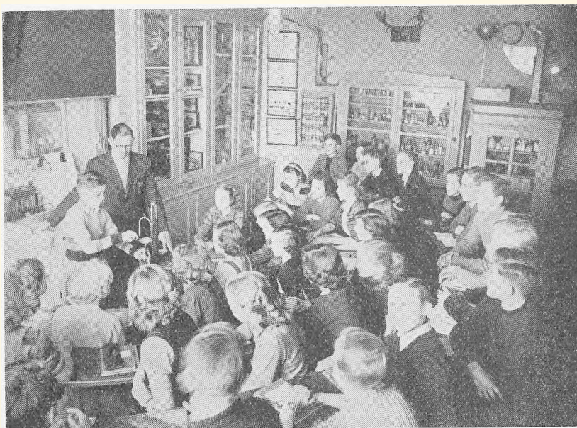
Fra Fysik- og Naturhistorielokalet.