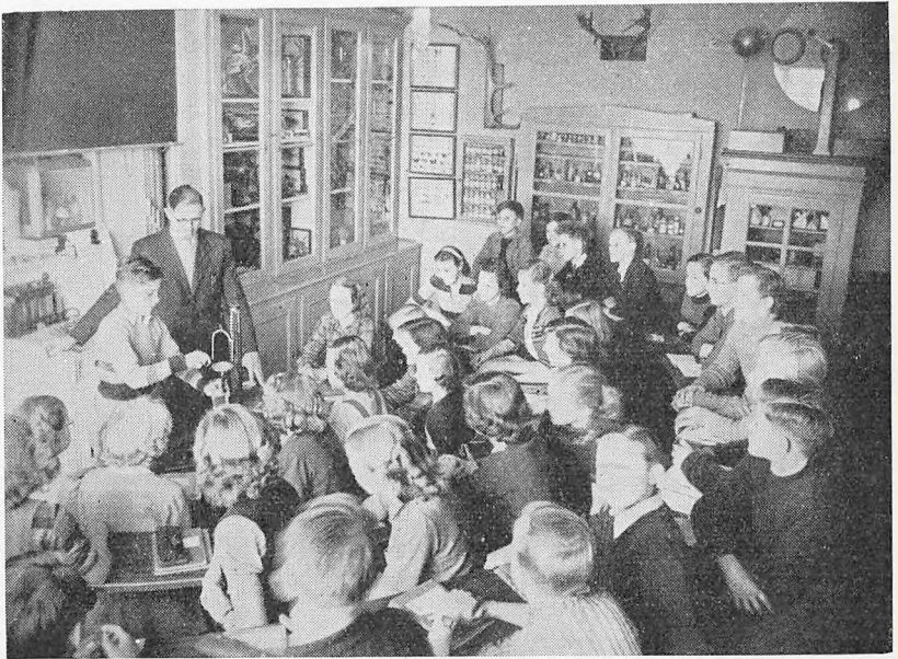
Fra Fysik- og Naturhistorielokalet.