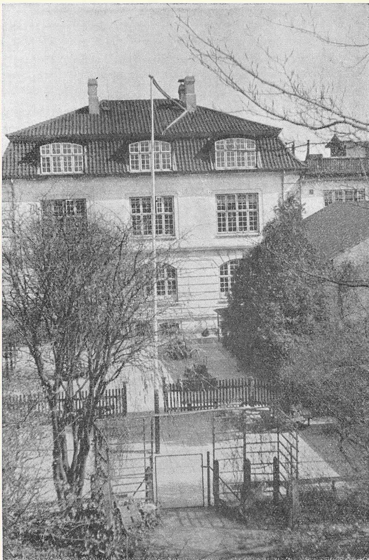
Skolebygningen og de to Legepladser — Underklassernes Legeplads i Forgrunden.