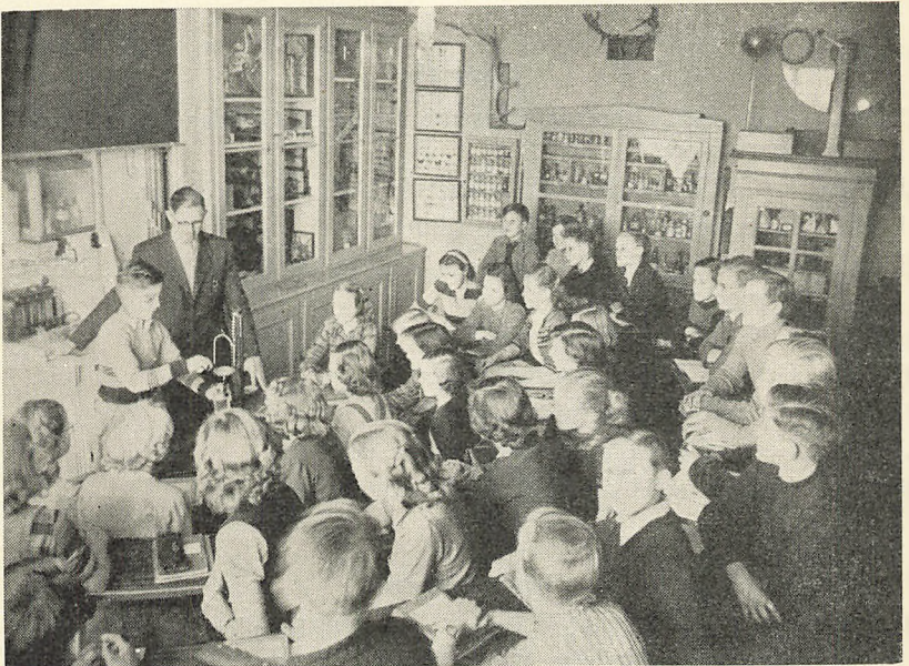
Fra Fysik- og Naturhistorielokalet.