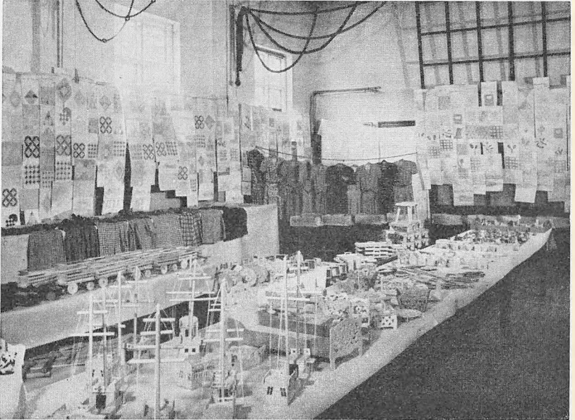
Udstilling af Elevarbejder.