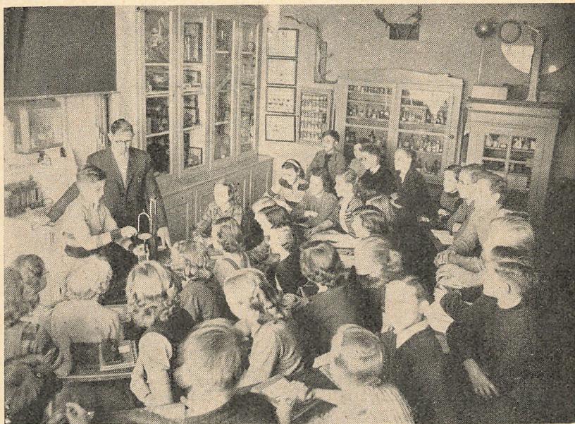
Fra Fysik- og Naturhistorielokalet.