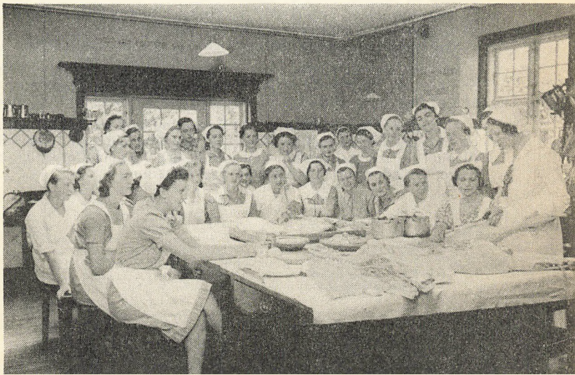
Køkken- teori gives

Dagens Gang: Kl. 7 (om Vinteren senere) Morgentur, Morgensang, Morgenmad. — Rengøring og Ordning af Stuer og Elevværelser. — Skoletime. — Kl. 9 \frac{1}{2} Køkkenteori og Forevisning. Praktisk Arbejde i Køkken, Vaskeri, Systue og Have. — Kl. 12 Middag, Opvask, Middags-hvile. — Kl. 4—6 Skoletimer, Haandarbejde o. l. — Kl. 6 \frac{1}{2} Aftensmad. — Kl. 9 Aftendrik og Aftensang.