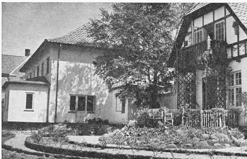
Dr. Steens Skolehjem.

Som Støttefag medtages Samaritтерgerning, Samfundslære, og Tavleskrivning.