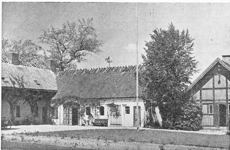
En Fløj af •Regensen• og •Landsbyens Skolekøkken•.