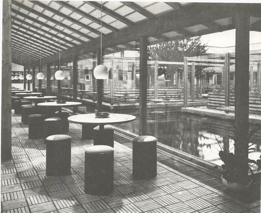
Spisegang og vandgård.