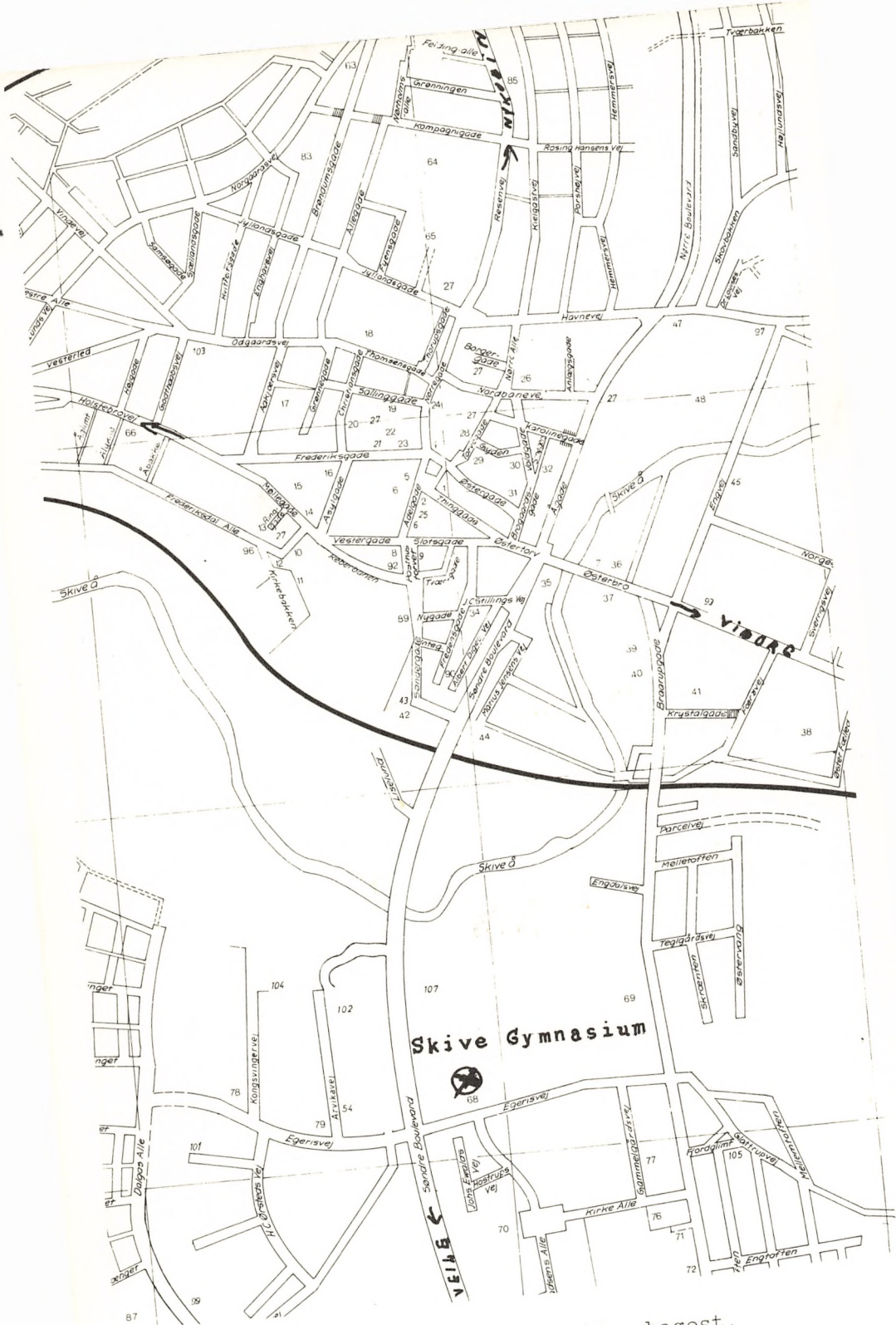
Plan over skolen på indersiden bagest.