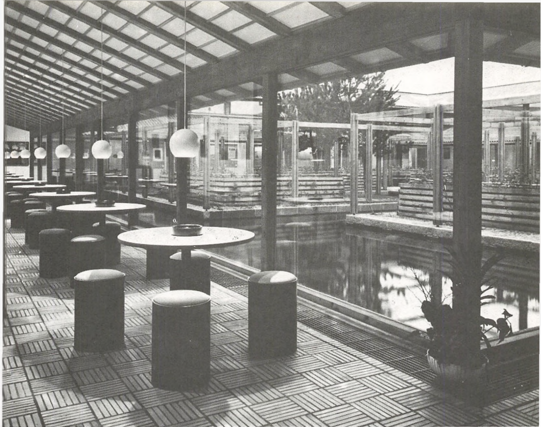
Spisegang og vandgård.