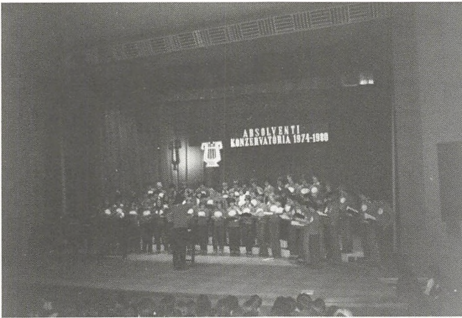
Billedet: Fra en koncert i Žilina, Tjekkoslaviet.