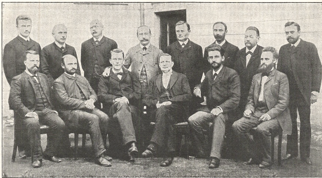
Lærerne ved Odense Katedralskole.

Ovenstaaende Fotografi af Odense Katedralskoles Lærere er taget 1890, og Personerne paa Fotografiet fra venstre til højre er: