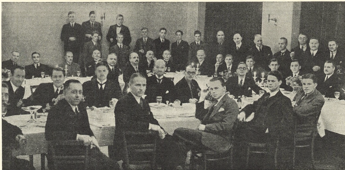
„Ddenseaner-Samfundet“'s Klubaften den 25. November.

manden, en smuk motiveret Tak til Aftnens Foredragsholder og en Velkomsttale til de 16 af Aarets 41 Ddense-Ruuser, der havde givet Møde som Medlemmer. Professorens udtalte Haabet om, at disse maatte befinde sig vel blandt deres ældre og gamle Kammerater fra den gamle Skole, og at de vilde kraftig agitere for at endnu mange af de resterende 25 af Aargangen indmeldte sig. Og saa udbragte vi et rungende Hurra for Ruuserne.