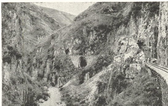
Tunnellen paa Banen mellem Haifong og Yünnanfu. Læg Mærke til den smalle Sporvidde (sml. de to Mænd, der gaar paa Banelinjen), og til de derved muliggjorte talrige Kurver.

første bekendtskab med en saa smuk opfindelse som flyvemaskinen skulde lære den at kende som et apparat, der spredte død og jammer om sig. — Vi hørte detonationerne, men kunde i den ende af byen, hvor vi stod, intet se. Maskinen gik atter et stykke bort, fulgte den samme linje tilbage og lod atter tre bomber falde. Dette skete endnu en gang, og den gik derefter ned ad floden tilbage til sin basis. En ung Amerikaner og jeg gik senere paa dagen ned til floden. Det var et sørgeligt syn, der mødte os. Paa flodbredden laa de dræbte og lemlæstede mennesker i deres blod, søfolk