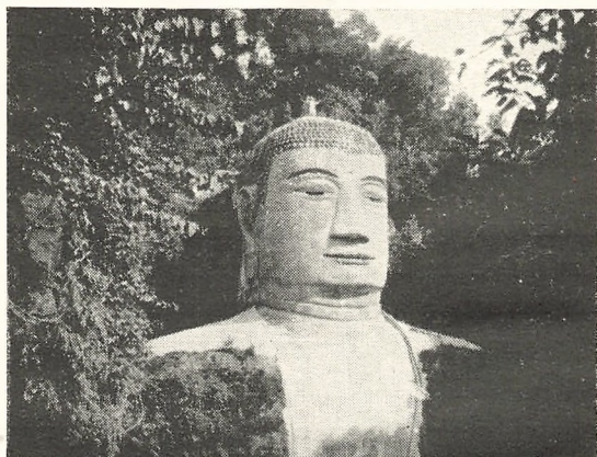
Den store Buddha ved Byen Kiating i Szechuan-provinsen. Figuren forestiller den samme Guddom, Maiduja, som Buddhismen senere — i 1000-tallet — gav den Skikkelse, der blandt Udlændinge blev kendt som den leende Buddha, den tykmavede Figur, har dannet det — meget fjerne — Grundlag for „Darduse“. Ansigt og Bryst er nyligt restaureret med et farvet Cementovertræk.

eller distriktets, byens, — ve og vel, har sikkert gjort sin gavn, underbygget som den var med henvisninger til det bedste, som landets egne bedste tænkere fra gammel tid havde givet slægten. I det ydre blev der, som man ogsaa vil have forstaaet det af aviserne i denne tid, gjort et stort og følgerigt arbejde med at knytte de forskellige provinser sammen. Det, der skete den engelske ambassadør, da hans bil blev angrebet af en fjendtlig flyvemaskine paa vejen mellem Nanking og Shanghai, kunde ikke være sket, da jeg rejste fra Shanghai i sommeren 1933, al den stund, at det dengang var umuligt at køre i bil længere end nogle faa mil ned til Hangchow ad den eneste — og ganske ny anlagte — automobilvej, der fra Shanghai gik ud over byens forstæder. Nu har fornylig biler kørt fra Shanghai til hovedstaden i Kweichow-provinsen, d. v. s. i det sydvestlige Kina, og hele arealet mellem Shanghai og Nanking samt Hangchow syd for Yangtze-floden er nu ompændt af en mængde udmærkede bilveje, der er ført gennem bjergene og over floderne af vesterlandsk uddannede kinesiske ingeniører.