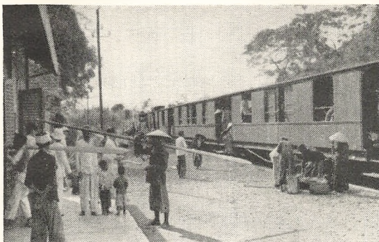
Den smalsporede Bane fra Haifong til Yünnanfu, en af Stationerne i det flade og vandrige Fransk Indo-Kina. Figuren længst til højre, samt den mørktklædte bag det hvide Aareblad, er annamitiske Kvinder; de farvede deres Tænder sorte, vi syntes afgjort ikke, at det saa godt ud.

Vi oplevede i slutningen af November maaned 1932 at se den første flyvemaskine, der nogensinde havde været paa de kanter, glide ind over byen Suifu, eller Hsufu, der ligger ved Ming Flodens udløb i Yangtze, 1700 miles inde i landet. Der var ingen modtagelse af piloterne ved borgmesteren eller byens ældste eller fest i anledning af denne enestaaende begivenhed. Maskinen var et bombeplan, der kom fra en angribende generals lejr længere nede ad floden, og resultatet af dens visit var ca. 10 mennesker dræbte og ligesaamange saarede. I den gaard, hvor vi stod, kom den hen over os paa sin ankomst til byen. Det var en ejendommelig fornemmelse at se den over sit hoved og samtidigt tænke paa, om det nu blot var en rekognosceringsflyver eller om den havde bomber med; — om den kunde se, at dette ikke var den store kaserne, (der laa lige ved siden af), — og — dersom den kunde, om den saa evt. var saa dygtig til at ramme, at den ikke ramte ved siden af og ramte os. Man tænkte det og meget mere i langt kortere tid,