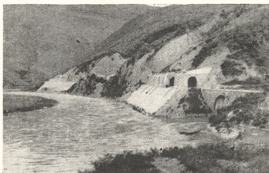
Tunnel paa Banen mellem Haifong og Yünnanfu

end det tager at skrive og læse disse linjer, men kunde jo ellers ikke foretage sig saa meget andet end netop at lade tankerne gaa gennem sit hoved og saa se, hvad der skete. Den gik videre, vi fik i en fart hentet en kikkert og kunde nu følge den paa dens vej langs med flodbredden, — som laa paa den anden side af byen end der, hvor vi stod. Pludselig saa jeg i min kikkert, hvordan 3 smaa aflange sorte genstande løsnedes fra maskinen og dalede lodret ned. Man vidste, at naar de om nogle faa sekunder naaede jorden, vilde antagelig huse blive ødelagte og mennesker dræbte. Det var nogle ubeskrivelige øjeblikke, fyldte af spænding og skamfuldhed over, at ens egen race havde opfundet saadanne mordvaaben og at en uskyldig befolkning som sit