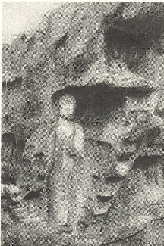
Byen Suifu i Szechuan-provinsen. Buddhistiske Klippe-skulpturer i en Klostergaard. Skulpturerne, som antagelig er fra omkring 1000-tallet, er karakteristiske ogsaa for tilsvarende Udsmykninger af Klipperne langs de store floder i Szechuan

en sammensvejsning af alle det store riges provinser til eet. I det ydre maa som sagt dette arbejde i øjeblikket hvile, men i det indre, i sindsindstillingen, er der ingen tvivl om, at denne sammensvejsning tager kæmpeskridt netop nu, og at der opbygges det aandelige fundament, som skal bære og give liv til den ydre enhed. Og er det aandelige grundlag først i orden, vil de ydre manifestationer ikke tøve med at vise sig. —