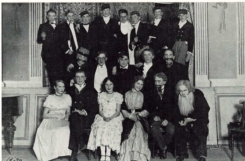
Skolekomedien 1929: Hostrup: „Genboerne“