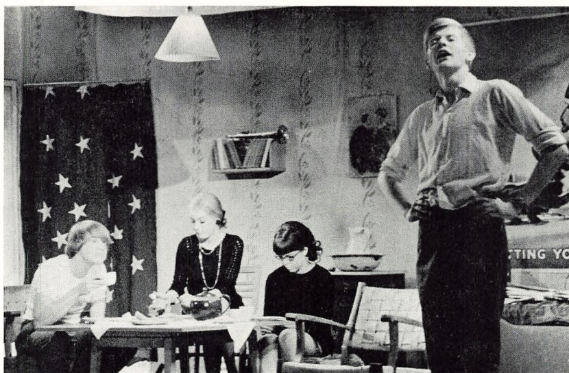
Skolekomedien 1967: John Osborne: „Ung vrede“

jeg) ud af, at man kunne dele de allerede implicerede i to grupper, så man akkurat kunne besætte to enaktere, som kunne prøves afvekslende. Det blev Sven Clausens „Kivfuglen“ og Carl Gandrups „Lazarus“. Alle blev reddet, og der blev endda en lille rolle til instruktøren som „forfatteren“.