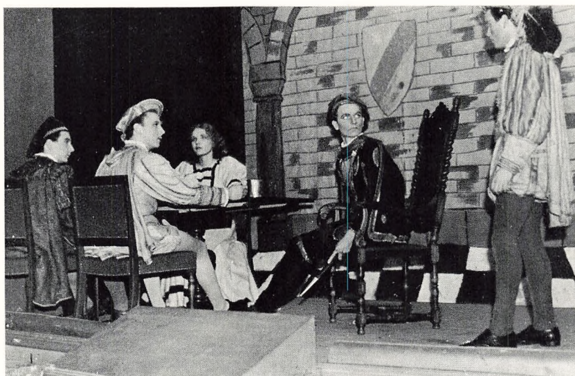
Skolekomedien 1945: Shakespeare: „Macbeth“

for at vende det hele en omgang. Det gik fod for fod, til det hele lå der med et øredøvende brag, så skolen rystede. At det ikke var ufarligt sås, da en bjælke faldt ned fra loftet og ramte en mand i hovedet. Han faldt som et fældet træ, men efter at han havde dvælet en stund som Hamlet med sit hoved i et jomfruskød, vågnede han op, greb en pilsner (der var altid øl til stede) og gik i aktion igen. En uheldig omstændighed ved denne opstilling var, at de optrædende samt det tekniske personale nu var lukket inde bag ved scenen under hele forestillingen, men dette problem løstes ved pedellens hjælp på en genial måde. Han bandt et par lange stiger sammen, så de nåede fra gymnastiksalen op til lufthullet bag flygelet. Så kunne der klædes om og sminkes i kælderen, og det gik lystigt op og ned ad stigen. Der var i min tid aldrig nogen, der faldt ned. Selv tog jeg turen et par gange uden at sidde fast i hullet.