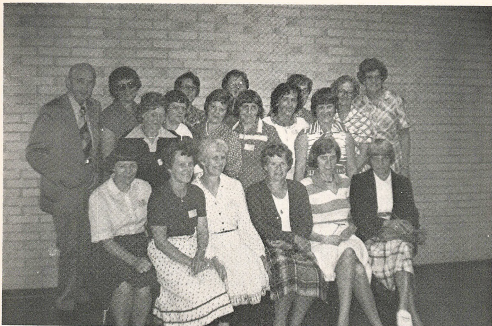
Jubilæumsfestens 25 års jubilarer

ver nok til en del af skolens virksomhed, der hedder højskole. Året igennem kører man en lang række kortere højskolekurser, men det er de længevarende kurser, det kniber med tilslutning til. Det er dog ikke udelukkende et Nissum-problem. Og stor eller lille tilgang. Under alle omstændigheder vil der også fremover skulle stå Nr. Nissum Høj- og Efterskole, og ikke blot sidste del af virksomheden.