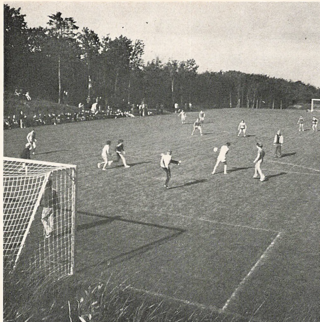
Fodbold på sportspladsen