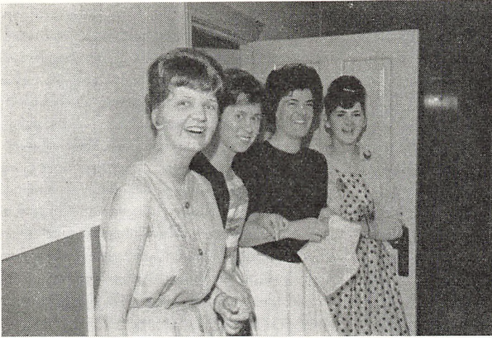
Et firkløver. Bladene er fra Lemvig, Skagen Tarm og Ranum.