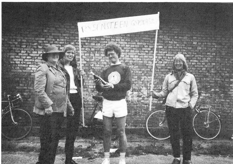
Rystensteen Gymnasium gør sig gældende ved et boldspilarrangement i Købbyen.