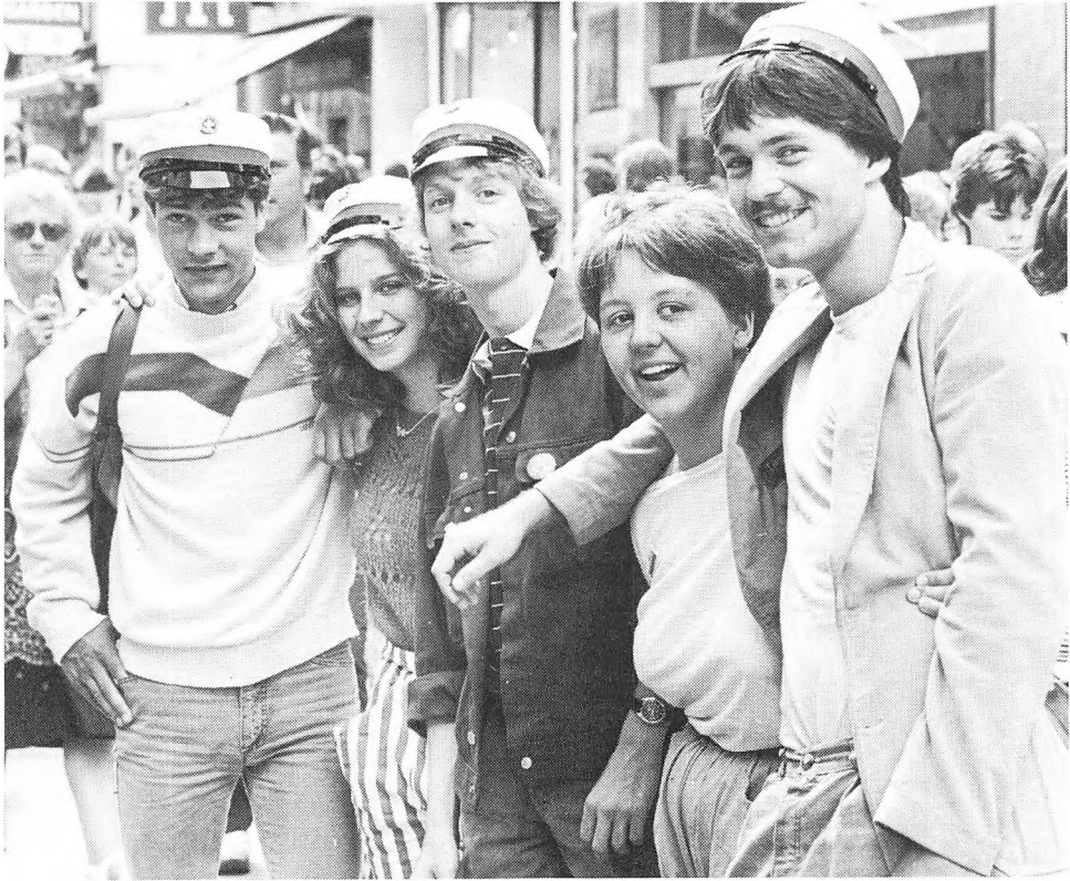
Studenter fra Rysensteen Gymnasium 84.