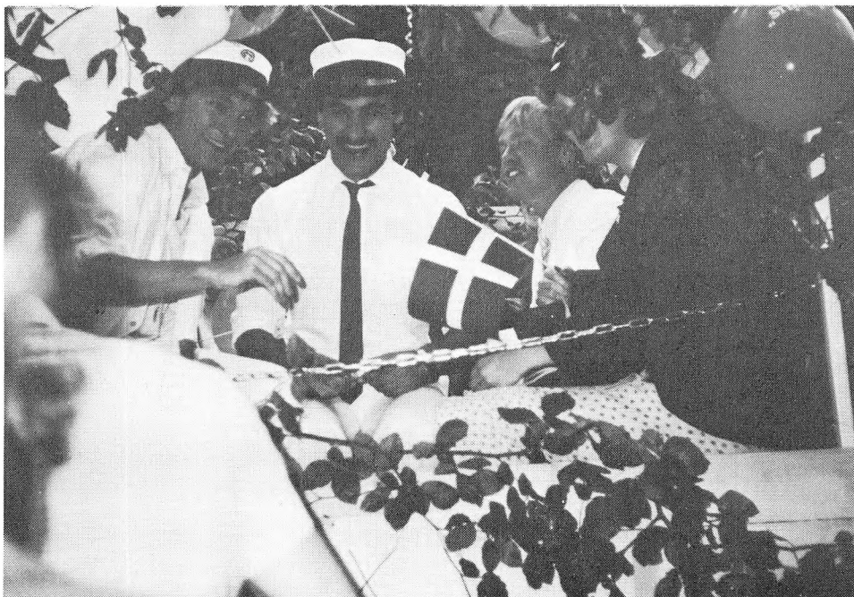
Studenter fra Rysensteen Gymnasium 83.