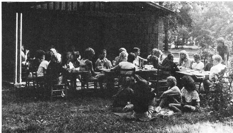
Fra 1. g'ernes introduktionsuge.

29/8: Teaterforestilling med 2z og 3b. Teaterbåden: »Hello and Goodbye« (Hø og Lis Rav).