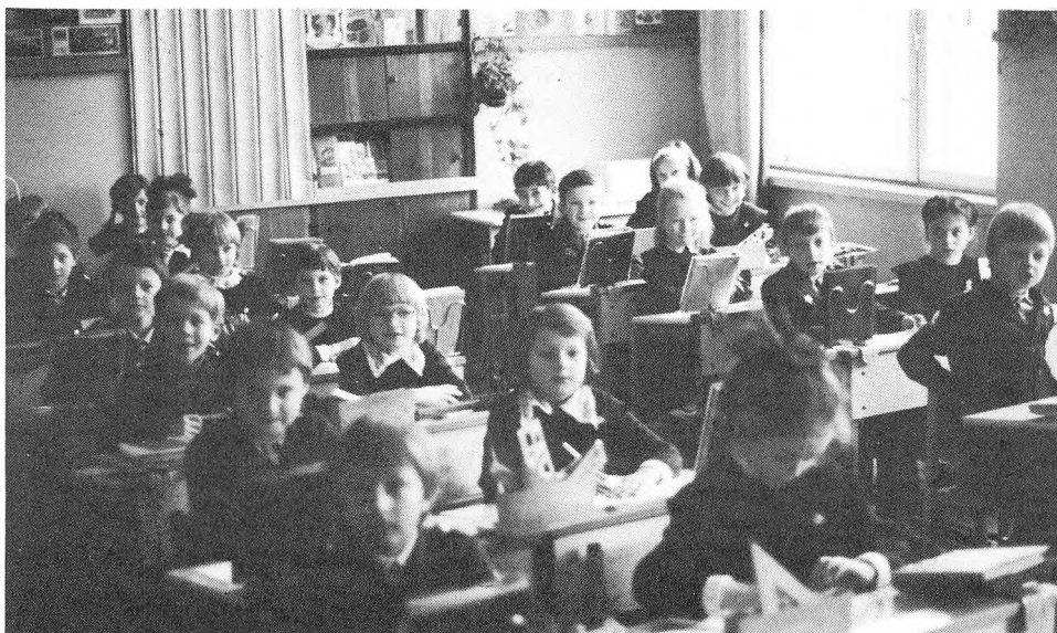
Fra en russisk 1. klasse.