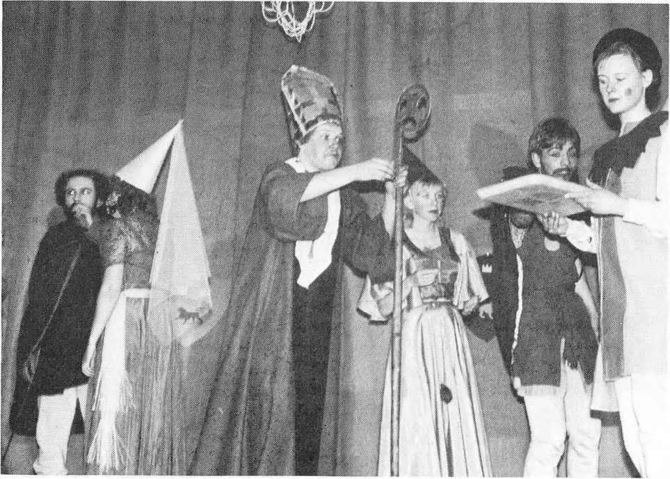
26.-27. april opførte dramatikholdet »Svend, Knud og Valdemar«.