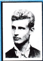
Skolens første studenterhold 1889