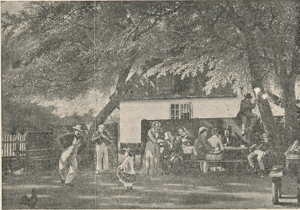
Gevinsten fejres ved en Skovtur.