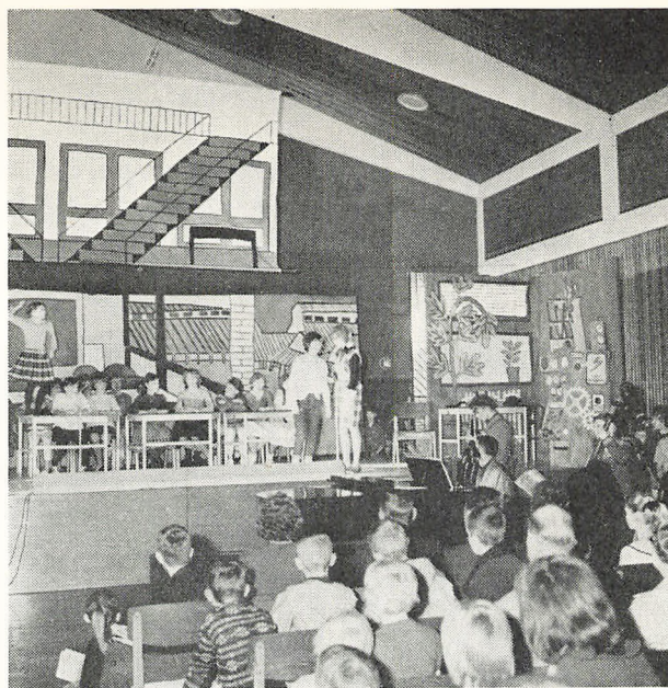
„Skolen på hovedet“.

litet, og poptonerne og -rytmen faldt afgjort i elevernes smag. Man dansede og morede sig og slukkede ind imellem tørsten med colaer eller is.