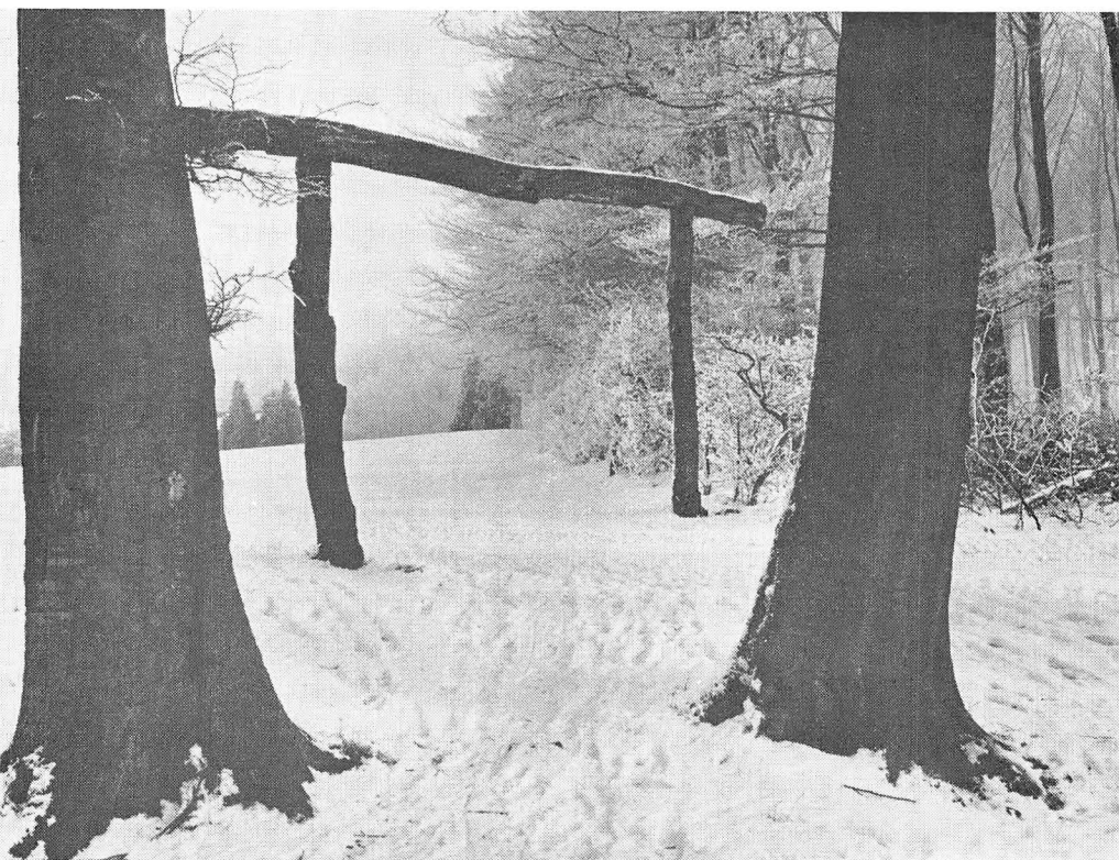
Skovbrynet i januar