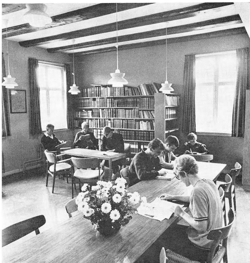
Aktivitet på læsestuen