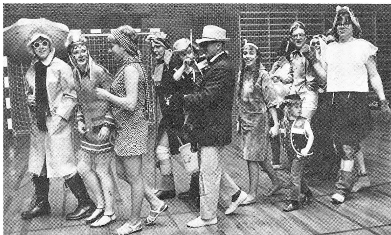
Fastelavnsgøgl i hallen

kursusvirksomhed især kan koncentreres om sommermånederne maj-august, hvor der ikke er elever.