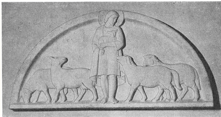
Johannes Hansen: »Den gode hyrde«. Skænket til Fårevejle Højskole 1955.