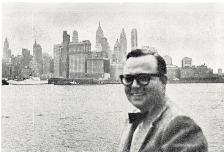
Indsejling til New York

Selve undervisningsformen er friere end i Danmark; der kræves gennemgående ikke noget videre af eleven i retning af eksakt viden, så de forskellige kollegier og universiteter jamrer til stadighed over, at eleverne er for dårligt udrustede, når de møder op og skal tage fat på studierne. Selve undervisningen er derfor lagt mere elementært an de første universitetsår, således at en amerikansk student egentlig først er parat til at tage fat på sit fagstudium efter to-tre års indledende kurser.