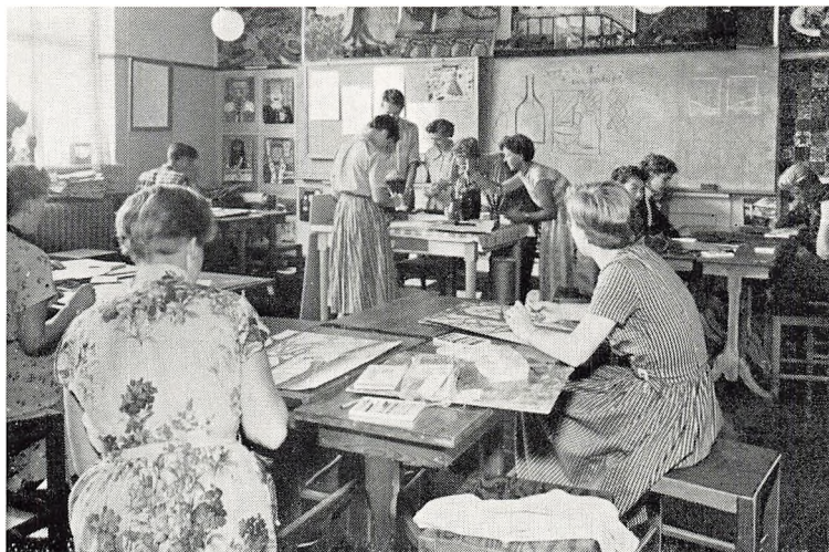
Interior fra tegnesalen

siges at være en fast tradition, at vi laver sådan en tur hvertandet år. Vi har allerede sikret os Sønderborg Idrætshøjskole til efteråret 58.