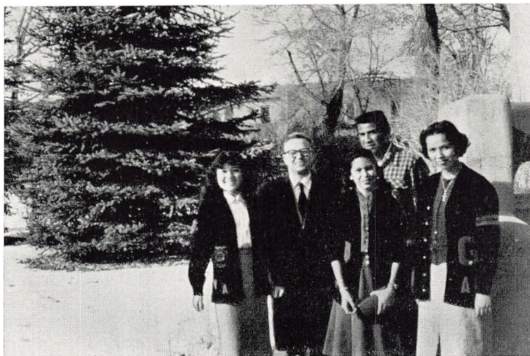
Mellem indianske skoleelever i Santa Fe

førende stormagt giver af og til frygtelige hovedpiner, fordi det som ung nation skal bære hovedansvaret mellem ældre og ofte mere erfarne kolleger. Forholdet i dag mellem Europa og Amerika er vel nærmest som mellem Grækenland og Rom i Oldtiden — dog med den undtagelse, at den moralske bevidsthed er betydelig større hos senatorerne i Washington end hos kollegerne i Tiberstaden.