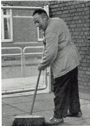
Kender I ham?