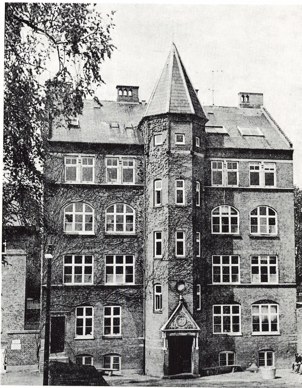
KURSUSBYGNINGEN Nyenstad 3