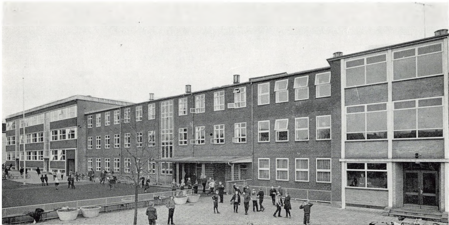
Et udsnit af Th. Langs Skolers bygninger. Fra venstre: den fælles naturfagsbygning, øvelsesskolen og længst til højre et stykke af seminariet.